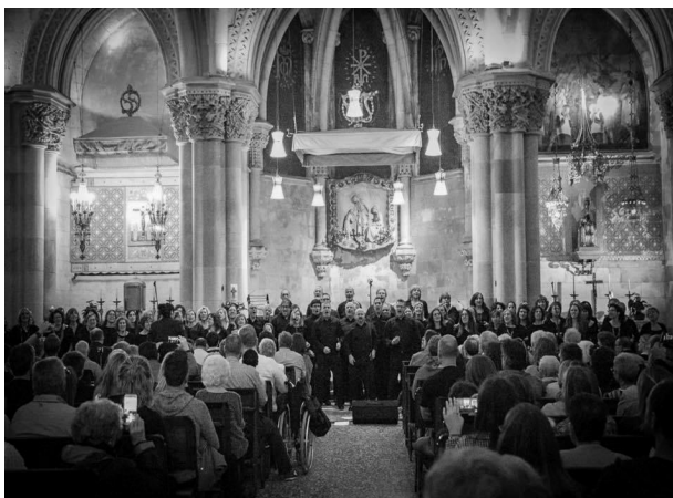
Coro de Góspel en la Cripta de la Sagrada Familia.