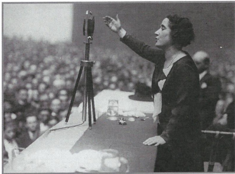
CLARA CAMPOAMOR PRONUNCIA UN MITIN EN SAN SEBASTIÁN

Diputada a las Cortes constituyentes de la Segunda República por el Partido Republicano Radical. Abogada y feminista, fue la principal artífice de la inclusión del sufragio de las mujeres en la Constitución de 1931. Sus vehementes intervenciones como miembro de la comisión constitucional quedan plasmadas en esta pieza parlamentaria, del 1 de octubre de 1931, durante la discusión del artículo 36 (extracto)