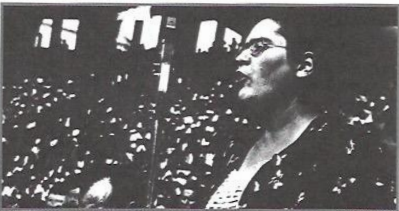
LA MINISTRA DE SANIDAD, FEDERICA MUNTSENY, EN UN MOMENTO DEL GRANDIOSO ACTO DE LA MONUMENTAL

nigo, armado y apoyado internacionalmente por esa falsa de actualidad, ha conseguido algunas victorias; y aunque no las hubiera conseguido, ha concentrado su esfuerzo máximo en la conquista de Madrid, que representa para él la totalidad de la información facciosa y para que los países legitimen su existencia de gobierno faccioso.