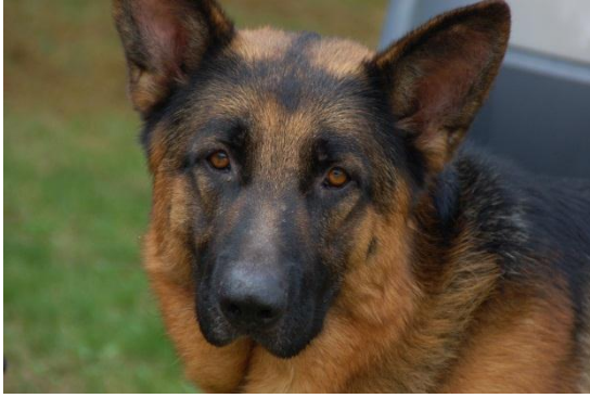
Fig. 13: Thor.