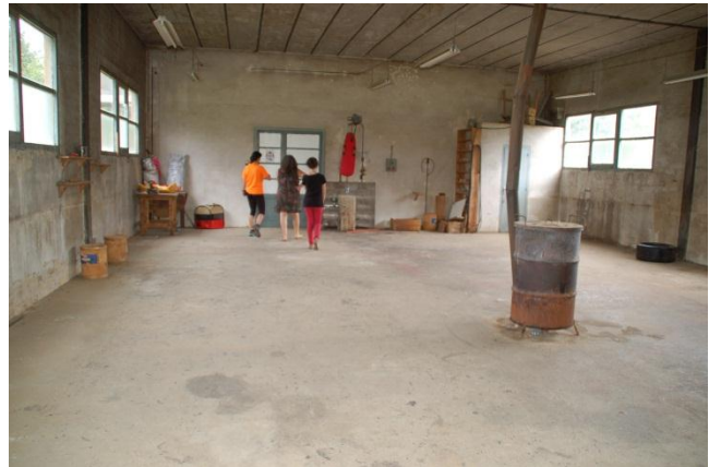
Fig. 16: Fàbrica on fan els entrenaments.