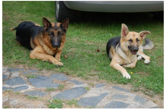
Fig. 6: En Thor (mascle, 2 anys) i l'Evo (femella, filla de Thor i Kata).