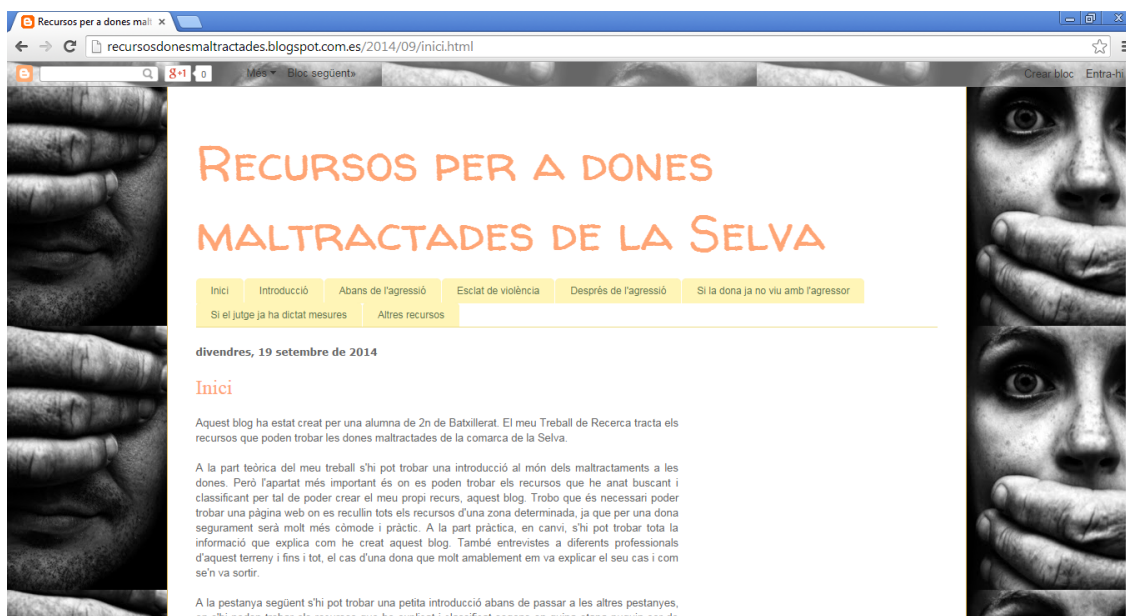
Fig. 2: Pàgina d'inici del blog.