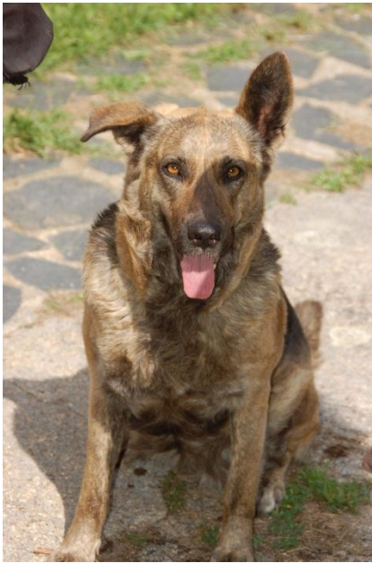
Fig. 15: Kata.