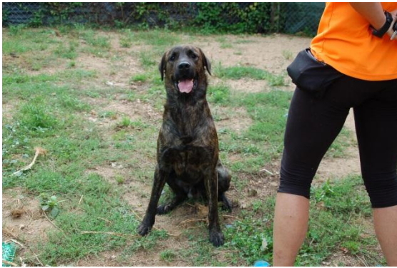
Fig. 5: En Chico (mascle, 2 anys).