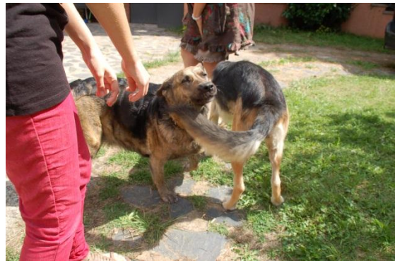
Fig. 8: La Kata i l'Evo.