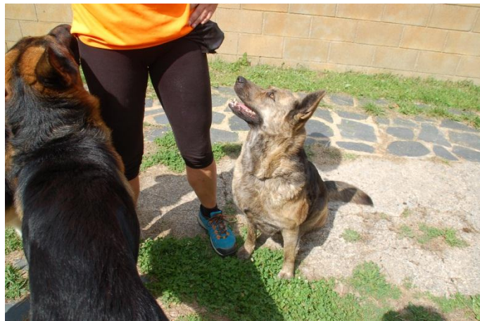
Fig. 17: Thor i Kata.