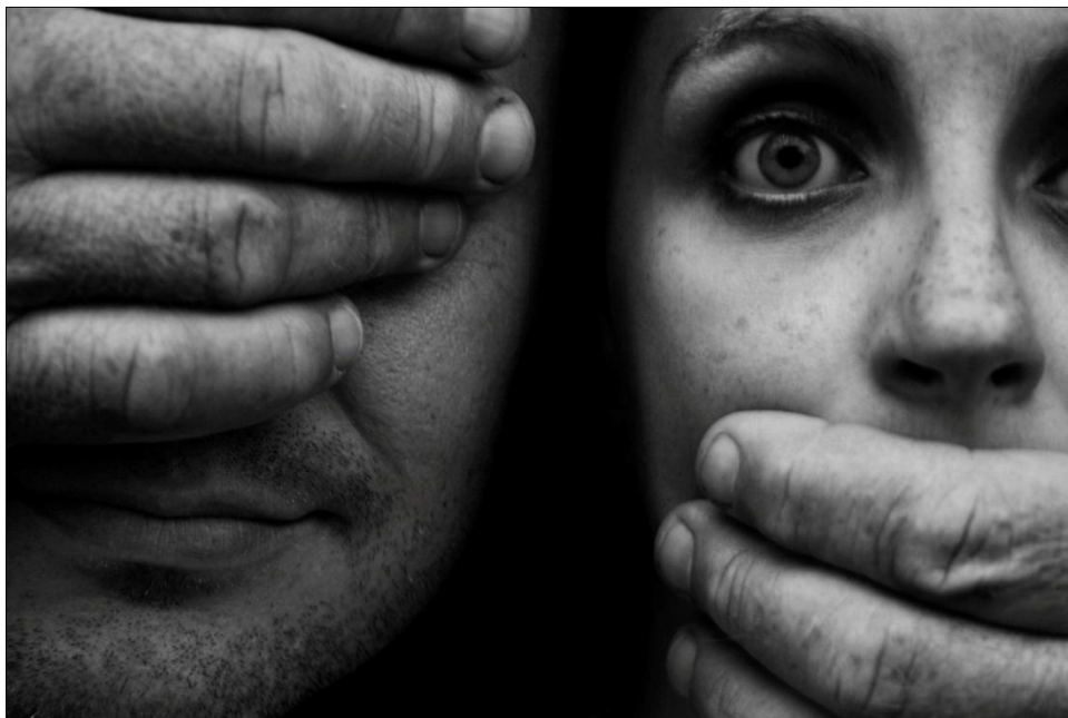
Fig. 4: Imatge seleccionada pel fons del blog.

Aquest crec que és el missatge que vol transmetre la fotografia i, com que em va agradar, vaig decidir posar-la de fons al blog.