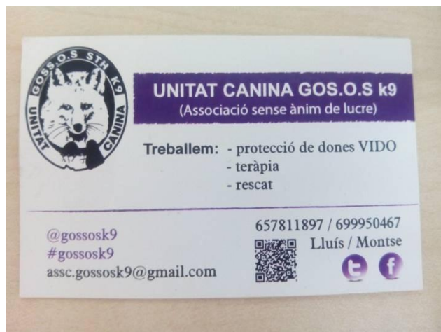
Fig. 9: Targeta de Goss.o.s K9.