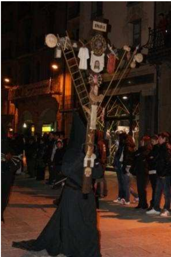
Processó dels Dolors de Vic, 2010. Congregant portant la creu dels impropis.

A l'Annex Documental d'aquest Treball de Recerca figura un estudi lingüístico-literari sobre aquest llibret 68 .