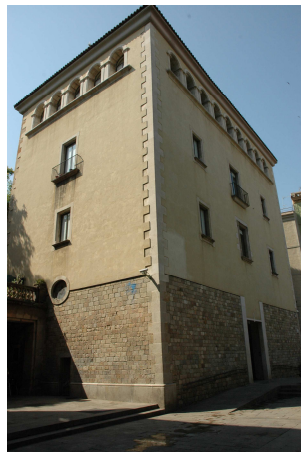
Convent del Bonsuccés. Barcelona.

Moltes associacions de devots, fossin o no confraries, que tenien en especial estima a la Mare de Déu dels Dolors, demanaven de ser admeses a l'Orde. A voltes eren els mateixos rectors de les parròquies que demanaven als Servents de Maria que fundessin a les seves parròquies una congregació dels Dolors per poder així “ofertar” als fidels participar d'una institució que, tot i que exigia una vida cristiana més compromesa i una austeritat en les formes i comportaments, en contrapartida s'obtenia una formidable catequesi i una major salut espiritual de cara a l'altra vida. A voltes eren altres ordes religiosos els que demanaven als Servents de Maria la fundació de congregacions dels Dolors. Però paral·lelament a la fundació de congregacions va sorgir el problema de la llunyania dels convents de frares envers les seves fundacions, i la falta de comunicació entre els frares i els congregants cada vegada era més acusada. Aquest fet va moure els Servents de Maria a compilar més detalladament la regla de vida de les congregacions, per evitar que en aquells indrets on els frares no poguessin arribar hi haguessin abusos o males interpretacions de la regla. Fruit d'aquest propòsit va veure la llum el Congregante y Siervo perfecto de fra Lorenzo Reymundinez, compilat com una regla de vida acurada i precisa, amb una explicació detallada de com havia de ser l'organigrama bàsic d'una congregació dels Dolors.