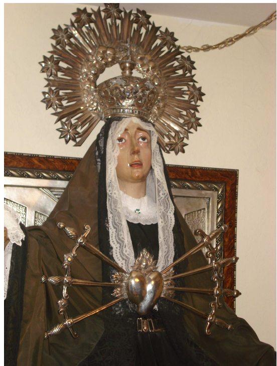
Mare de Déu dels Dolors de Ca l'Antic. Any 2010.