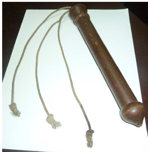
Flagel de disciplina. MASMM

Entretanto que durará la disciplina, se dirá á coros el Salmo del Miserere, el Corrector un verso, y los demás otro.