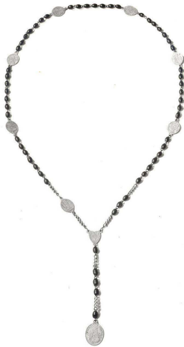
Rosari per resar la Corona Dolorosa

Durant l'últim terç del segle XX moltes congregacions van modificar la durada de les jornades d'aquest exercici i el Septenari es va transformar en Quinari, passant de set a cinc dies.