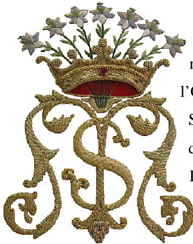
Emblema de l'orde, amb la "S" (Servents) i la "M" (Maria) sobreposades i una corona de set lliris, simbolitzant els Set Sants Fundadors.

Pràcticament tots els llibres que s'han escrit sobre les Congregacions dels Dolors, tant a nivell històric com a nivell espiritual, comencen amb la narració de la fundació de l'Orde dels Servents de Maria, anomenats popularment Servites, destacant en tot moment que les Congregacions dels Dolors són fundacions servites. Les Congregacions dels Dolors són filles espirituals d'aquest Orde, i per tant veuen el seu origen en la fundació d'aquest Orde mendicant 1 . És una tradició que es remunta als primers devocionaris per als congregants, del segle XVII, va continuar amb les narracions històriques i folklòriques del segle XIX i ha perdurat fins a l'actualitat, i hem considerat oportú no trencar amb aquesta riquesa. La font principal d'on beuen