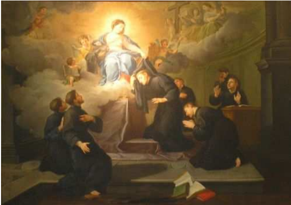
La Verge entregant l'hàbit als Set Sants Fundadors de l'Orde Servita. Pintura italiana del segle XVIII. Autor desconegut.

Per últim, he de dir que aquest és un treball de recerca per a una història més completa de la Congregació dels Dolors i de la seva Capella a Berga. No és un treball definitiu. És un treball preparatori a l'espera de més investigacions que puguin aportar noves dades, arrodonir els plantejaments actuals i precisar molt més les conclusions.