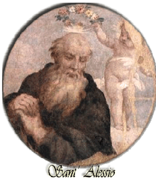
Sant Alessio Falconieri