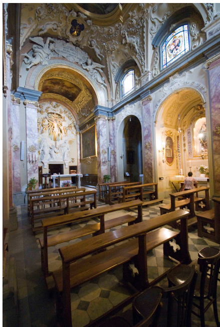
Altar de Monte Senario, lloc d'enterrament dels Set Fundadors.

branca seglar o orde tercer secular 4 . En aquesta butlla hi ha redactada la regla de vida que havien de seguir els coneguts com a terciaris, i que serà el germen dels estatuts i les constitucions de les Venerables Congregacions de la Mare de Déu dels Dolors, el nom que l'Orde Tercer dels Servents de Maria va adoptar a Catalunya.