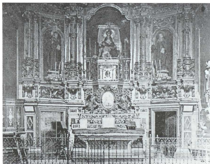
Altar de la capella de Nostra Senyora dels Dolors (Arxiu Luigi, Berga).

Un inventari dels béns de la congregació fet l'any 1780 76 permet conèixer quin era l'estat del retaule i de la capella un segle abans de redactar-se el manuscrit. L'absència de les imatges dels dos servites a la descripció de l'altar que es troba en l'inventari confirma la modernitat d'aquelles. Segons aquesta descripció, a cada costat del retaule hi havia inicialment la figura d'un àngel, però no s'indica la seva posició ni mitjançant quin suport o enquadrament les figures s'integraven al conjunt.