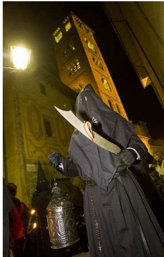
Processó dels Dolors de Vic, 2009. Congregant portant l'espasa amb l'orella de Malcus.