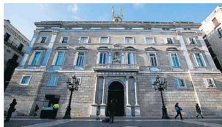
El Palau de la Generalitat i l'adjacent Casa dels Canonges és l'escenari on s'ha cuinat l'acord aquests últims dies.

I ara? Aprovar al Parlament al gener que es reclami al Congrés, per la via de l'article 150.2 de la Constitució, delegar competències per fer la consulta i, per si cal recórrer a la legalitat catalana, tenir a punt al març la llei de consultes. El procés cap a l'estat propi (i independent) fa via sense perdre cap llençol.