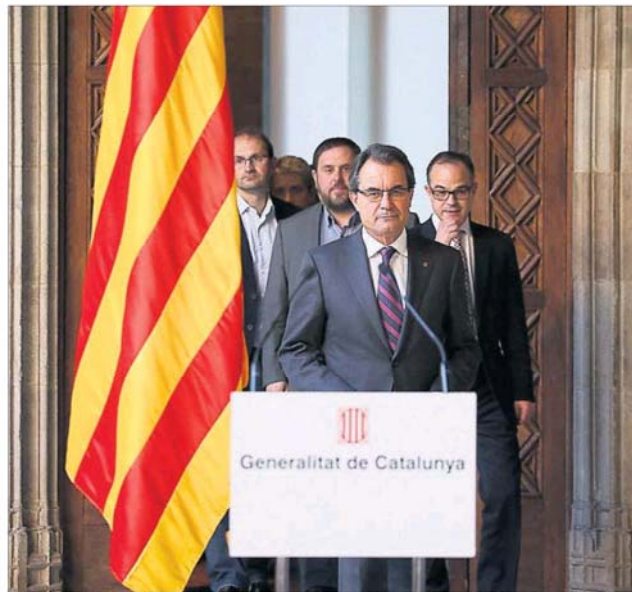
Artur Mas, junto a los líderes de los partidos que apoyan la consulta, en el palacio de la Generalitat.