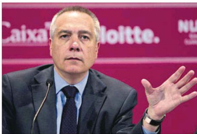
Pere Navarro durante la conferencia que pronunció ayer en la Cámara de Comercio de Barcelona.

El PSOE tardó apenas media hora en reaccionar a las palabras de Pere Navarro. Un portavoz del partido las calificó de "totalmente inadecuadas" y dijo que no las compartía "en absoluto". Navarro contrarreplicó que "respeto" a su partido hermano no comparta su petición de abdicación y se negó a realizar más valoración.