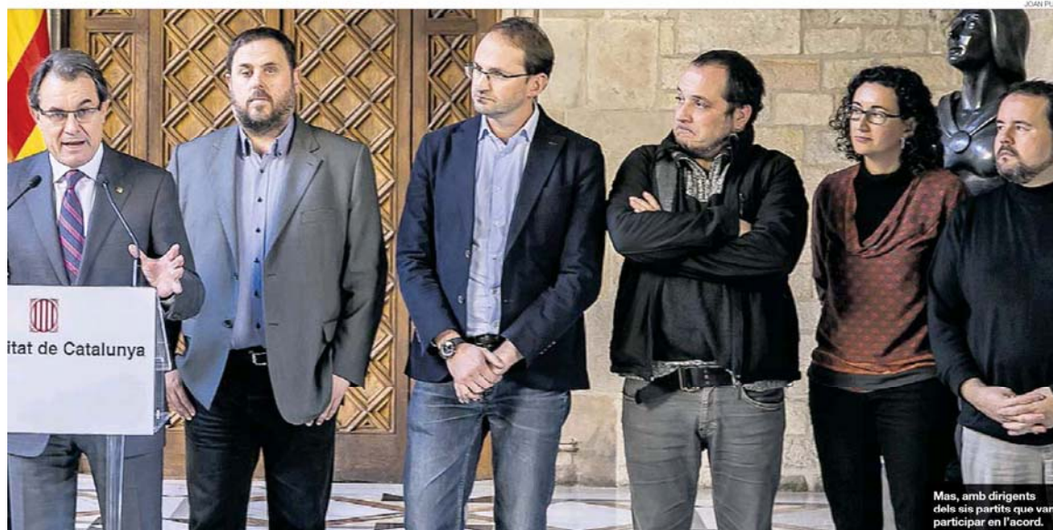
Mas, amb dirigents dels sis partits que van participar en l'acord.