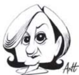
29 CRISTINA GALLACH Consell de la UE

DIJOUS 4 D'ABRIL DEL 2013 NÚMERO 850 1,30 EUROS