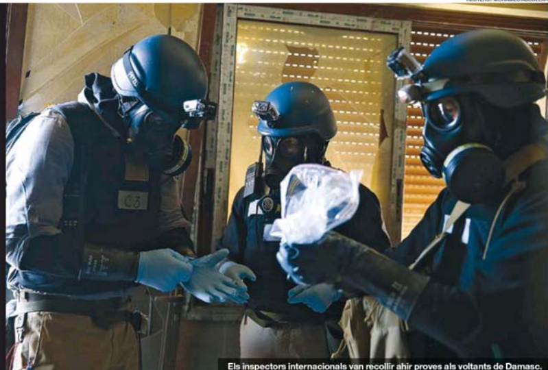
Els inspectors internacionals van recollir ahir proves als voltants de Damasc.