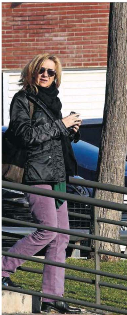
La infanta Cristina e Iñaki Urdangarin el pasado martes.

ha sido analizada por el juez junto a un buen número de correos y declaraciones de imputados y testigos a lo largo del último año. Hace un año el propio juez Castro y, también la Audiencia de Palma, ya había rechazado la imputación de la hija del Rey, que fue reclamada por el pseudosindicato ultra Manos Limpias. Entonces no se vieron suficientes indicios de implicaciones y no se constató que la Infanta interviniera en las actuaciones económicas de su esposo. Ahora el juez sí ve indicios de que pudo ser copartícipe de una cuenta corriente entregada a la princesa Corinna (amiga del Rey) para unos cobros.