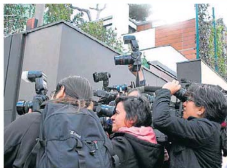
El cas Nòos ha captat una gran atenció dels mitjans. És el primer cop que la monarquia està tan clarament enfangada.