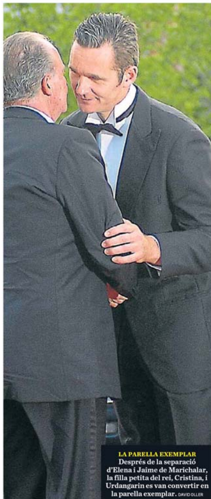
LA PARELLA EXEMPLAR Després de la separació d'Elena i Jaime de Marichalar, la filla petita del rei, Cristina, i Urdangarín es van convertir en la parella exemplar.