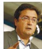
►► Óscar López.

El dirigent del PSOE va destacar que cada informació que surti a la llum situa Mariano Rajoy més a prop de l'«epicentre d'aquest escàndol», i va afegir que la situació del president del Govern «és insostenible». Per això, va reiterar que el PSOE continuarà exigint la seva dimissió i que se sàpiga «tota la veritat». López va insistir, com ja ha fet en diverses ocasions, que el que va començar sent el cas Gürtel i després el cas PP, avui ja és el cas Rajoy. La persecució continua, fins al pròxim capítol.