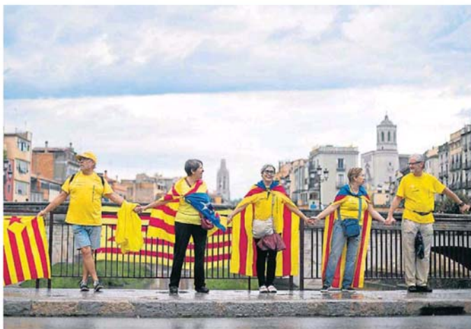
Al llarg de les últimes setmanes, l'ANC ha organitzat cadenes humanes prèvies a la de l'Onze de Setembre per posar a prova els aspectes logístics necessaris perquè la iniciativa sigui un èxit. DAVID BORRAT