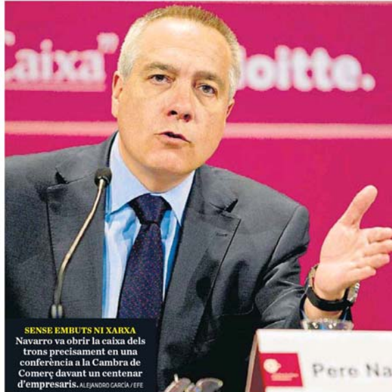
SENSE EMBUTS NI XARXA Navarro va obrir la caixa dels trons precisament en una conferència a la Cambra de Comerç davant un centenar d'empresaris.

Però la petició de Navarro va caure com una galleda d'aigua freda al PSOE, que es va afanyar a deixar