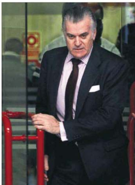
Luis Bárcenas sale de la Audiencia el pasado 15 de marzo.

mitiendo de este modo la verificación de la diligencia propuesta".