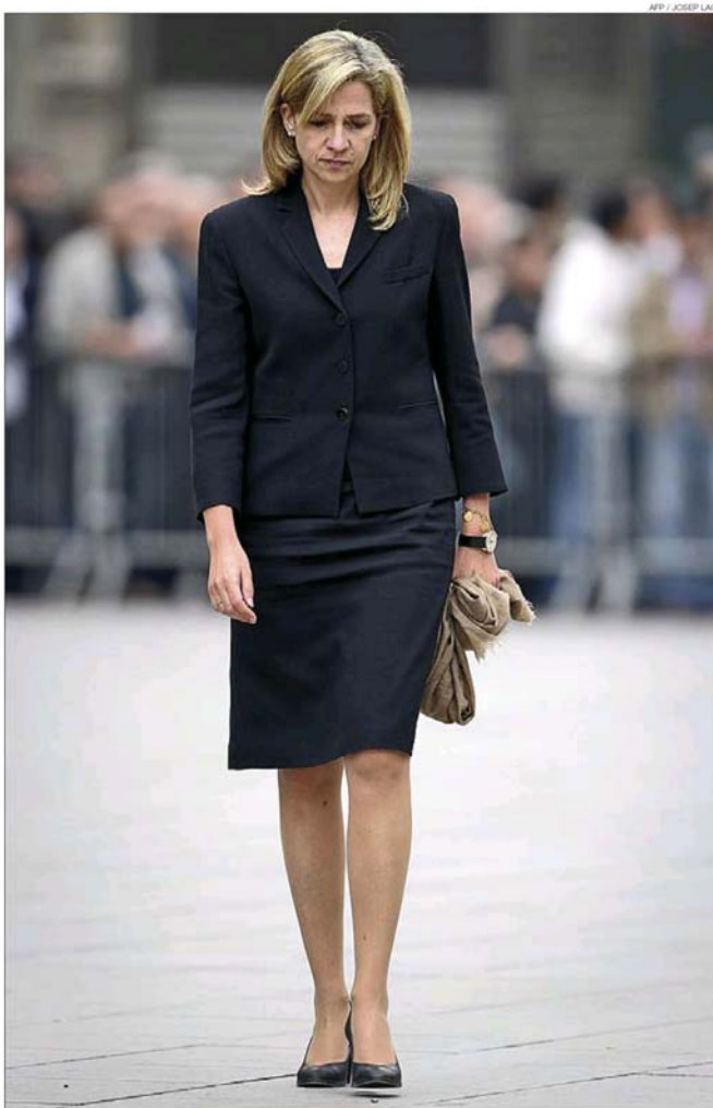
La infanta Cristina, l'abril del 2010, al funeral de l'expresident del COI Josep Antoni Samarach.