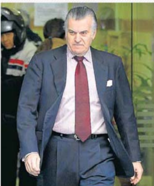
L'extresorer del PP Luis Bárcenas al mes de març sortint de l'Audiència Nacional.