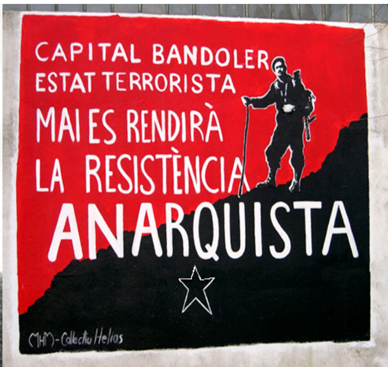
Ideari anarquista que defensà Sabaté.

La societat celonina considera que possiblement algun dels participant en al seva mort continua viu i que realment l'amnistia militar de l'estiu del 1976 i la política del 1977 no podran esborrar mai aquells crims franquistes que van en contra de la Humanitat.