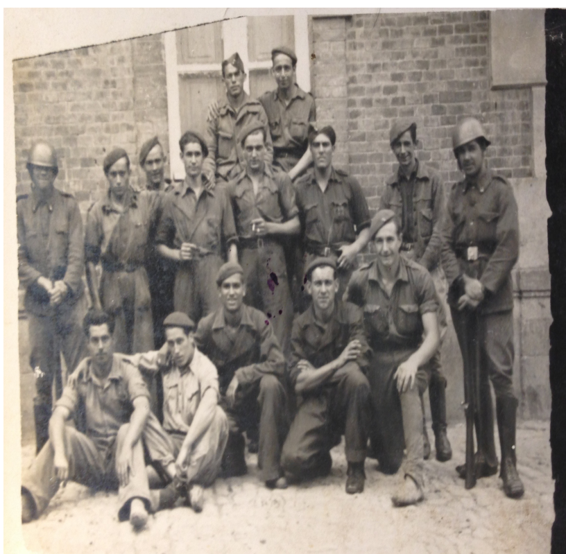
Membre de la quinta del meu besavi

- Per últim m'agradaria il·lustrar la imatge de les quintes formades per homes que realment encara se'ls podria denominar nens. Entre aquest grup de reclutats pel front està present el meu besavi situat a la part inferior; el segon començant per l'esquerra que està assegut al terra. Tots ells; o si més no la majoria van ser obligats a molts anys de formació amb la inquietud de quan serien enviats als fronts. Sortosament el meu besavi