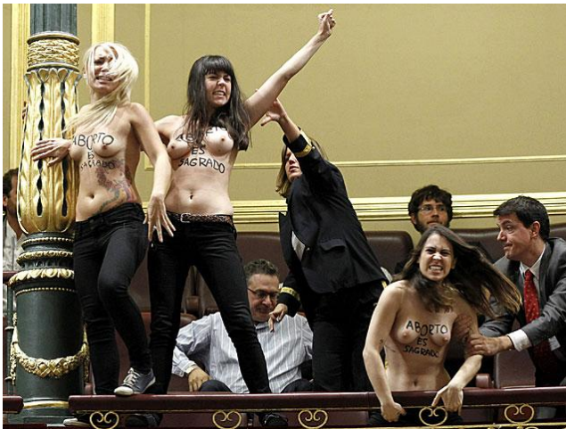
Il·lustració 5 Activistes de Femen irrompen al congrés amb el crit de avortar es sagrat

Segons Gallardón és <<una aposta per la llibertat de la dona>>. Quina llibertat? La de haver de viatjar a Londres per poder avortar? La d'haver de recorre a una clínica il·legal o be de morir dessagnada per aquelles dones que no puguin pagar? No te res a veure amb la llibertat d'obligar amb una mare a portar setmanes en el seu ventre