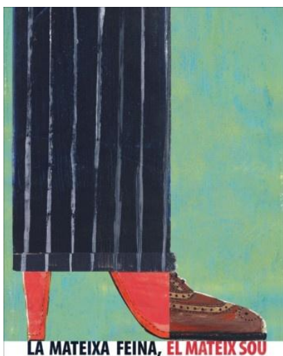
Il·lustració 2 Dia internacional de la dona 2012.

El problema es que no sabem com conciliar una multitud de temps o d'espais que s'entrecruen amb ritmes diversos i que presenten característiques diferents quan som mares, filles, esposes, veïnes, mestresses de casa, treballadores assalariades... el temps es essencial per a la vida i per prendre decisions, si les dones tenim el 99% del temps ocupat en feina domèstica incloent-hi també la feina assalariada, només ens queda un 1% per pensar en nosaltres i per poder prendre decisions o simplement relaxar-nos.