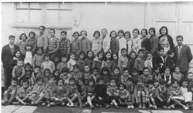
Il·lustració 7 1933 alumnes de l'escola Racionalista de Salt. Situada al centre Obrer de Cultura la Floreal fins el 1936 fou l'única escola mixta de les comarques gironines. la seva proposta pedagògica era molt innovadora, atorgava autonomia als nens i els despertava.

El model actual d'escola coeducativa pretén superar el sexisme i l'androcentrisme