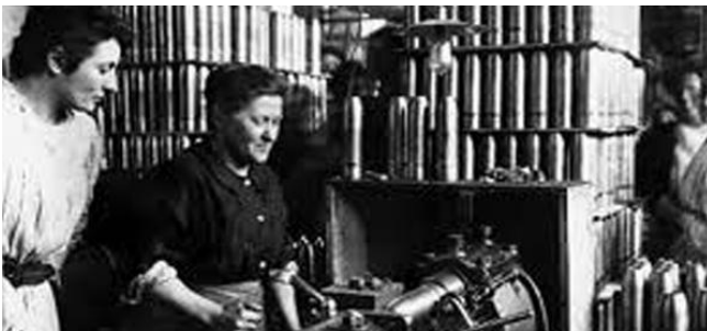
Il·lustració 3 Les dones a les colònies tèxtils Catalanes.

El món rural, va patir unes transformacions tècniques de l'agricultura i a causa d'això, ja no es va necessitar tanta mà d'obra femenina, però en canvi a la ciutat van aparèixer moltes més feines alternatives. Per exemple, va augmentar el servei de dones a les cases, servei domèstic que van arribar a constituir entre un quart i la meitat de la població treballadora de les ciutats, dependents, dides que eren les dones que