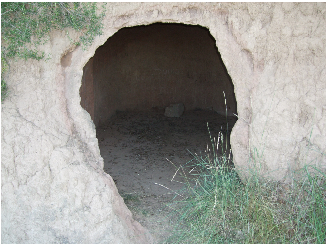
Estat actual de l'amagatall de Cal Bernoi, Clariana de Cardener.

Curiositats: Aquest amagatall té un forat a la part superior de la sala. És un forat d'uns 22 cm d'amplada i (actualment) uns 20cm de llargada. A causa del clima, les tempestes, el pas dels anys.. s'ha anat tapant. Antigament però, aquest forat era possiblement un forat de ventilació. Fins i tot, podem pensar que l'utilitzaven per a tirar el gra des de dalt del marge, ja que se sap que aquest amagatall havia tingut funció de graner.. 11