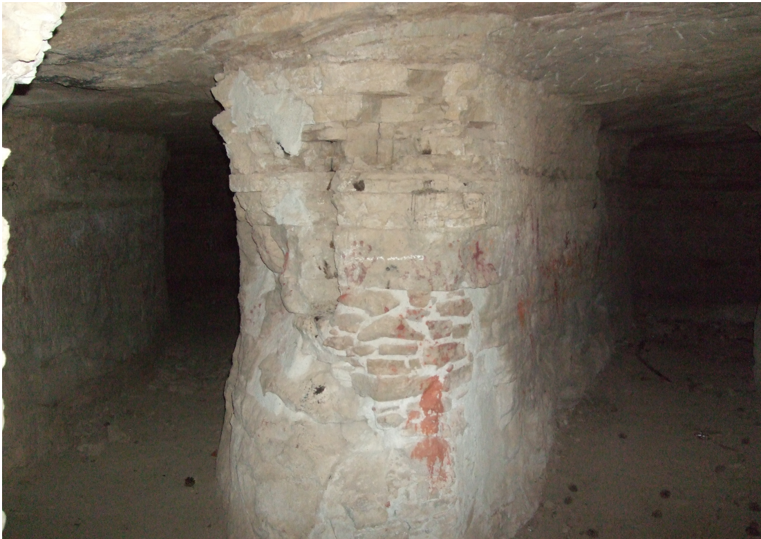
Imatge actual de l'interior del refugi antiaeri del Pi, Clariana del Cardener.

Curiositats: La construcció del refugi pot estar relacionada amb els bombardejos que patí Solsona el juny del 38; en aquella ocasió, els avions franquistes buscaven, segurament, el polvorí de les tropes republicanes, situat vora la carretera de Solsona a Berga, però en lloc de caure on s'havia previst, l'escenari va ser prop de la caseta dels refugiats, als afores de Solsona i provocà la mort de cinc persones. 14