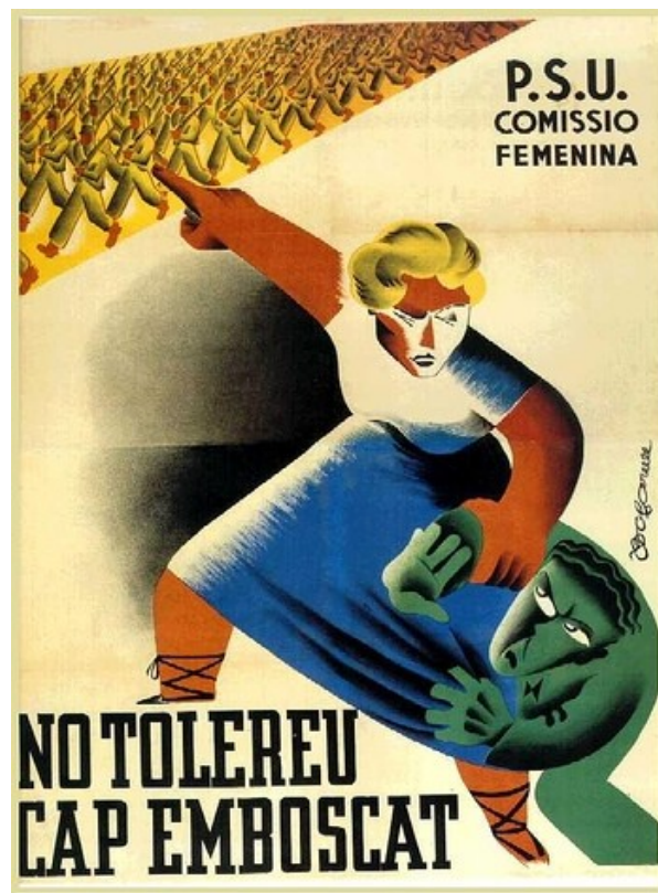
Cartell del Partit Socialista Unificat de Catalunya que data del 1938. Volia convèncer a les dones de la importància de que els homes s'allistessin al front.

Tot plegat demostra que el fenomen dels emboscats va tenir una amplitud molt més important que la que donen a entendre les poques pàgines dedicades a aquesta qüestió dins el conjunt historiogràfic sobre la guerra civil. 1