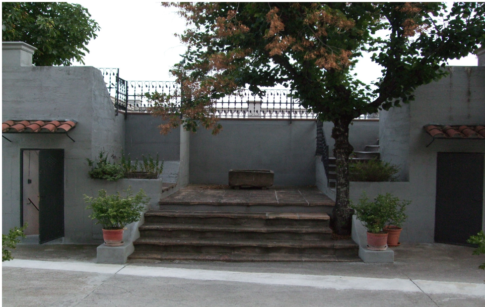
Imatge actual del refugi de la família Boix-Martínez ubicat al passatge Vil·la Riu.

A més a més: La maternitat del Seminari, el comissariat a Cal Rotés (al passeig), la torre Vil·la Riu i l'Hotel Sant Roc, van ser quatre dels punts més importants durant el conflicte. 3