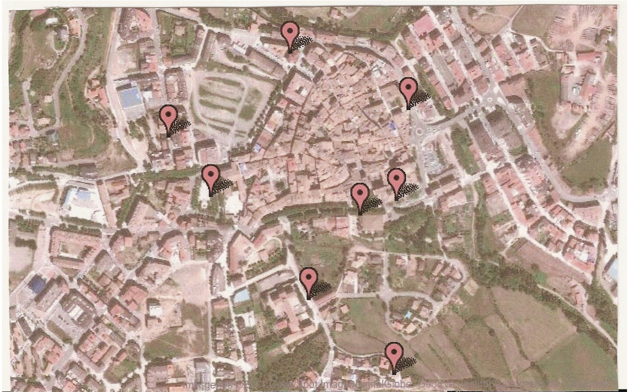
Refugis de la Ciutat de Solsona.