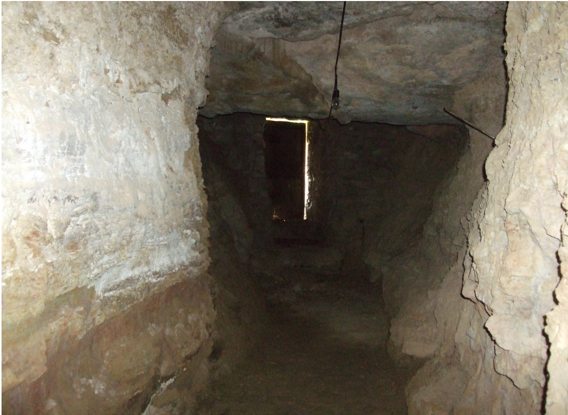
Imatge actual del túnel ubicat al soterrani de la masia Cor de Roure, Brics.

A més a més: En el llibre La persecució religiosa de 1936 a Catalunya , escrit per Joan Serra Vilaró, s'anomena la masia en qüestió. Diu que van amagar-s'hi capellans i gent que havia de fugir i en destaca la hospitalitat de la família 13