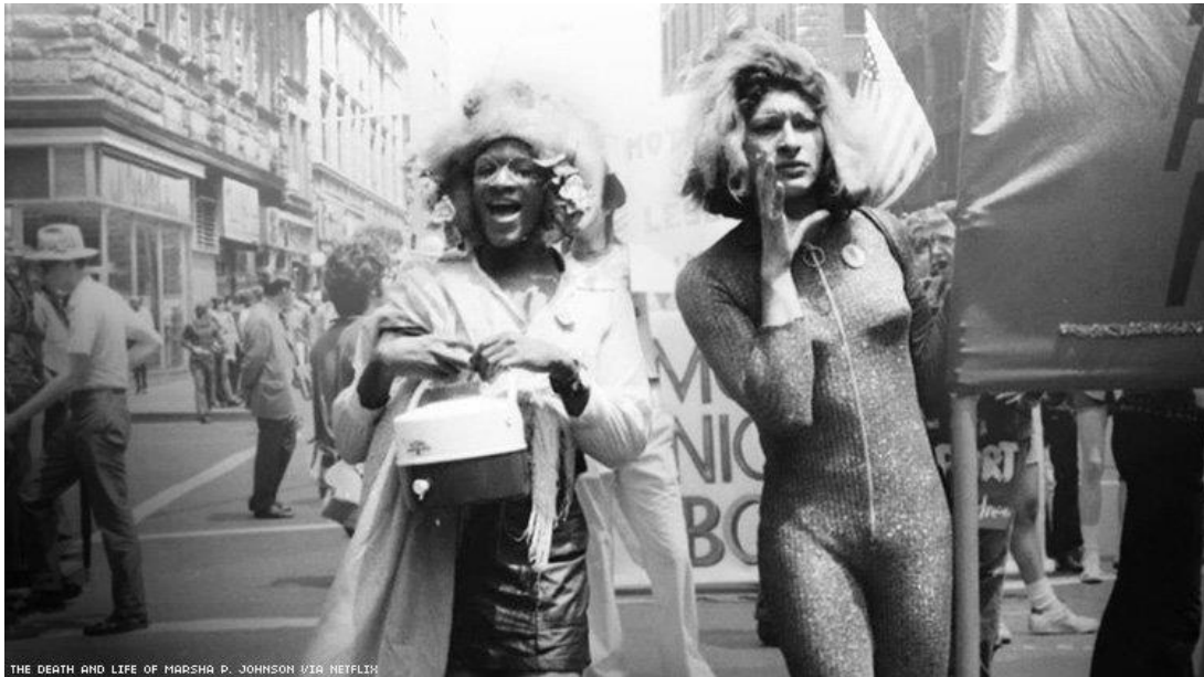
Marsha P. Johnson i Silvia Rivera, dones trans referents als disturbis de Stonewall.

Els disturbis de Stonewall van suposar un abans i un després molt gran pel col·lectiu LGTBI a nivell mundial. Aquí l'Estat espanyol encara romania en la dictadura (1936-1975) de Francisco Franco. No va ser fins a dos anys després de la mort del dictador espanyol quan el col·lectiu LGTBI a Espanya va començar a reivindicar els seus drets i va començar a exigir una protecció bàsica per les persones de la comunitat amb la primera manifestació estatal del col·lectiu (1977).