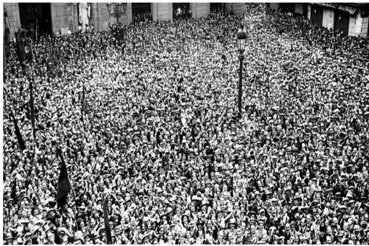
La plaça Catalunya el 14 d'abril arborant la bandera tricolor.

...l'emoció més profunda que ens reservava aquest dia. Fou a tres quarts de dues de la nit. [...] I sona clara, neta la veu d'un oficial que llegeix -en català!- la proclamació de la República de Catalunya. [...] En Macià ha acabat el seu parlament, i el silenci dura encara, fins que un crit triomfal, un Visca l'Avi! que tot el poble respon, desfà la màgia d'aquest somni i ens torna a la realitat, una realitat molt més bella que cap somni 13 .