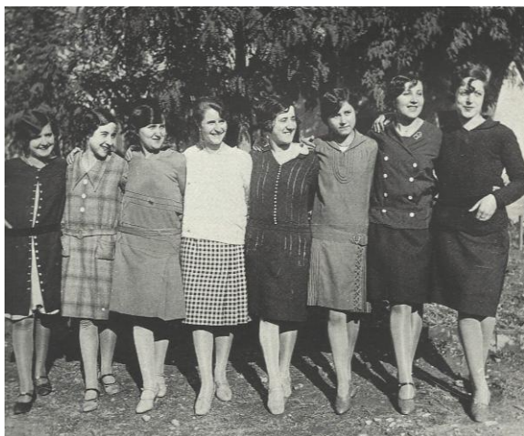
Grup de modistes vigatanes celebrant el seu dia