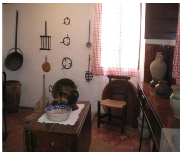
Detall d'una cuina-menjador típica andalusa. Casa de Niceto-Alcalà Zamora.