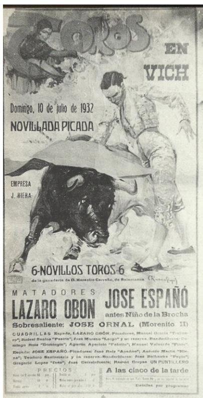
1932. Cartell publicitari de les curses de braus vigatanes.

Va ser l'única vegada que vaig poder veure en directe un d'aquests espectacles; fou l'acompliment de tot un somni.