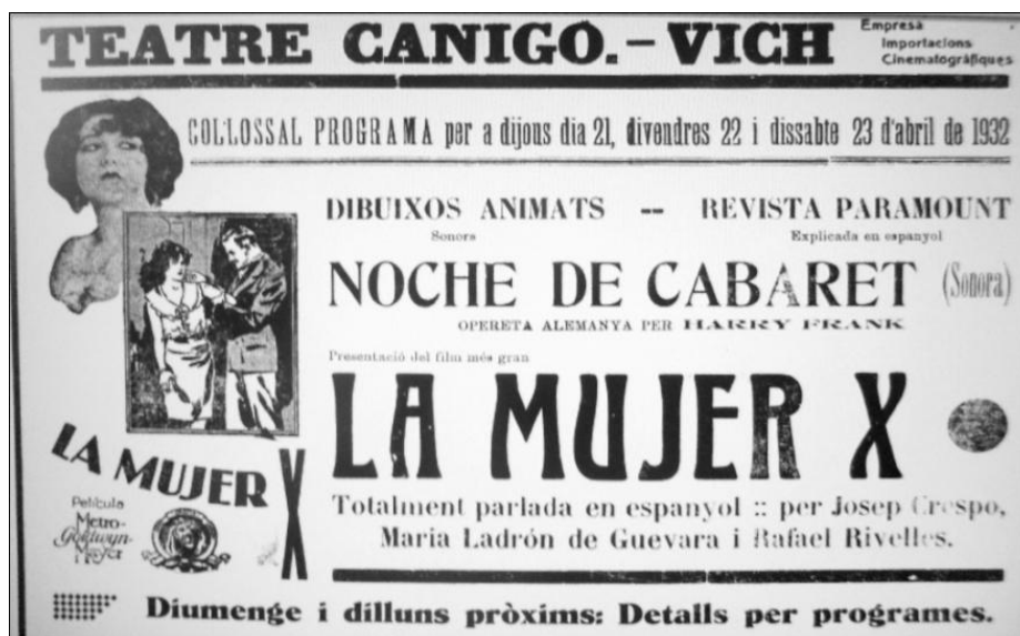
La publicitat del cinema, pomposa i habitual del cinema Canigó.

Tot i la gran rellevància que la República volia atorgar al sentiment nacionalista i a la llengua en especial, els films mai es van projectar en català, tal com es pot veure en els cartells publicitaris: “Totalment parlada en espanyol”.