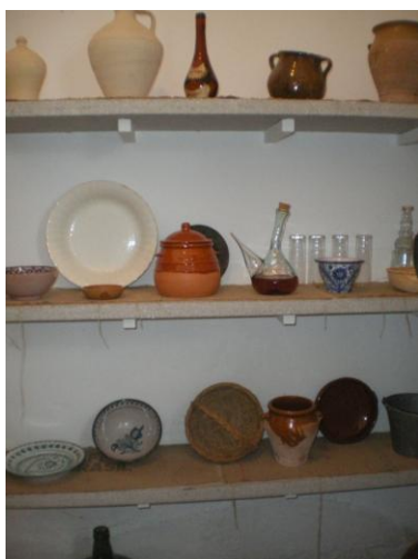
Detall d'una "cantarera". Casa de Niceto Alcalà-Zamora

Aquest tipus de cases, malgrat pertànyer a famílies humils podien ser de dimensions considerables i sempre tenien un generós pati dedicat, òbviament, a la producció de fruites i verdures per a l'autoconsum.