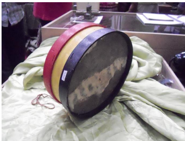
Tambor per a infants pintat amb els colors de la bandera republicana