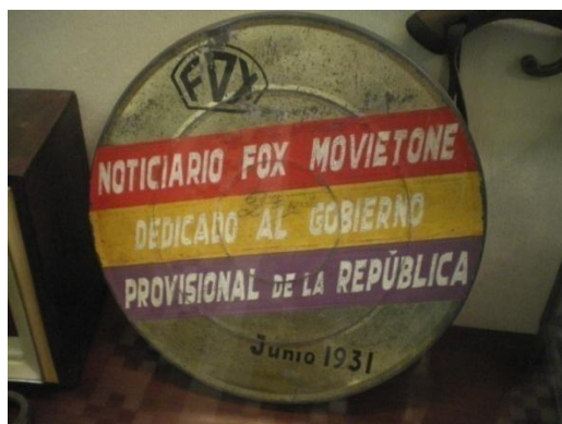
Noticiari de la companyia FOX per congratular la República.

del poble. Bailén, essent també de caire rural i petit comptava amb dos recintes teatrals que, a la vegada, funcionaven com a cinema: el d'estiu i el d'hivern. Obrien sobretot els vespres perquè tenien en compte les jornades dels obrers. Allà, l'entrada valia tres pessetes. "Hi anaven companyies teatrals molt bones, de les millors d'Andalusia, com El Arroyo " assegura Rafael Moga sobre la seva ciutat natal. Al mateix recinte, tenien lloc filmacions molt llargues que s'oferien per parts. Mantenien la intriga fins al final de cada episodi a fi de mantenir l'audiència el dia següent. A més, el govern estatal va promoure la difusió de la cultura a través de les companyies teatrals. La més famosa fou la "Barraca", dirigida pel poeta i dramaturg Federico García Lorca, la qual va voltar arreu d'Andalusia, incloent Torredonjimeno i Bailén, per tal d'acostar la literatura castellana a les masses camperoles, sovint, analfabetes.