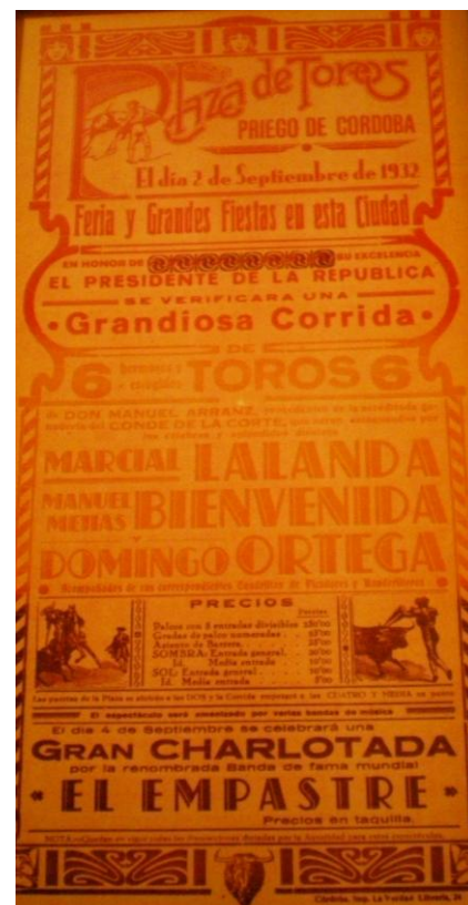
1932. Cartell publicitari de les curses de braus de Priego de Córdoba.