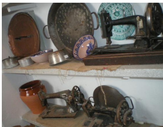
Detall d'unes màquines de cosir situades en una "cantarera". Casa de Niceto Alcalà-Zamora

Cal destacar l'abundància de les màquines de cosir a la llar. Aquest fet s'explica tenint en compte que moltes dones cosien i feien la roba per altra gent. Es tractava d'una activitat molt corrent, especialment quan arribava alguna festa en què s'havia d'estrenar alguna peça de roba. Tant era així que va començar a sovintejar l'ofici de lesmodistes. Confeccionaven els vestits comprant els metres de tela als magatzems de Santa Clara o de Bansell, que oferien la següent taula de preus: tela amb dibuixos, 0.4 pessetes per metre; sedes estampades o llana de colors llisos, 2.50 pessetes per metre; trajo blau per a mecànic, 10 pessetes la unitat. 42