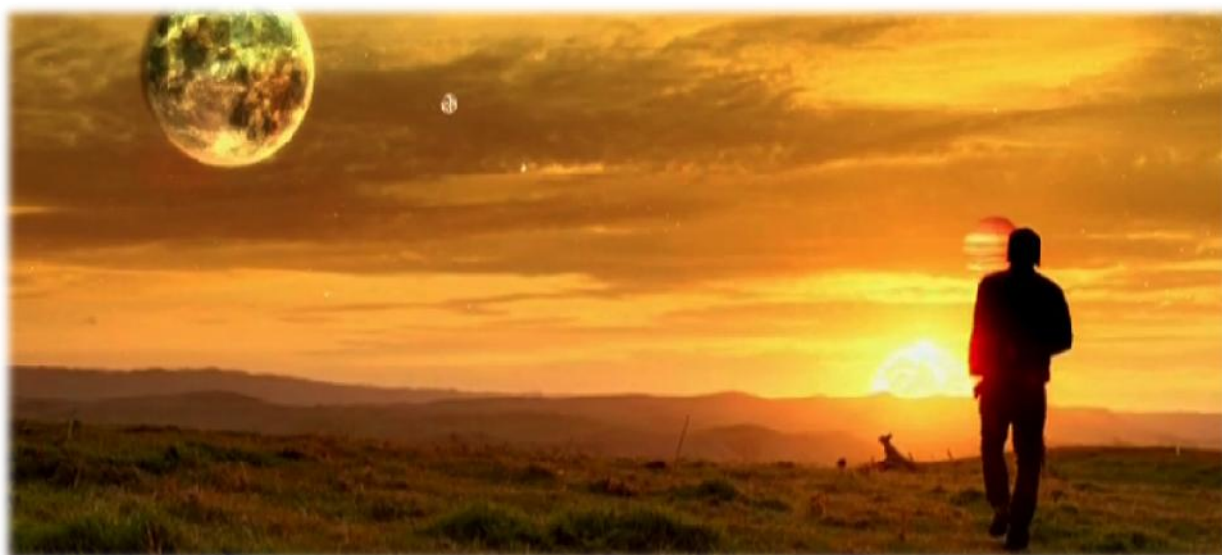
Imatge del videoclip de The Adventure : totalment especial.

Les repeticions d'algunes parts com són el pre-cor i el pont les utilitza per donar-li solemnitat a la cançó i, per suposat, importància a la part instrumental. En aquest cas, aquest single no destaca per tenir una lletra "espacial", no obstant això, es considerada una de les cançons més representativa del grup per musicalitat, és a dir, pels instruments.