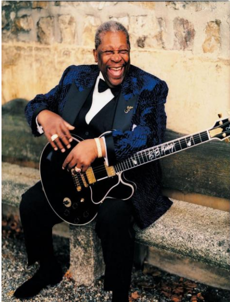
B.B King amb la seva estimada guitarra Lucille