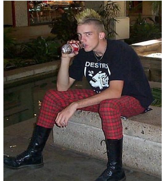
Patró de vestimenta d'un fan del punk.