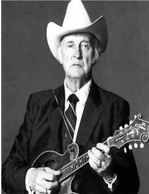
Billie Monroe, un dels màxims exponents del country

rockabilly , el so Nashville , el bluegrass i el so Bakersfield . Els intèrprets de country que han passat a la història de la música han sigut Hank Williams amb el seu Heygoodlookin 1 , Bill Monroe amb Blue Moon of Kentucky .