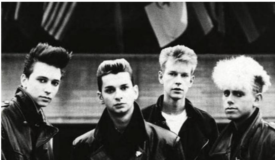
Integrants del grup de rock psicodèlic Depeche Mode.