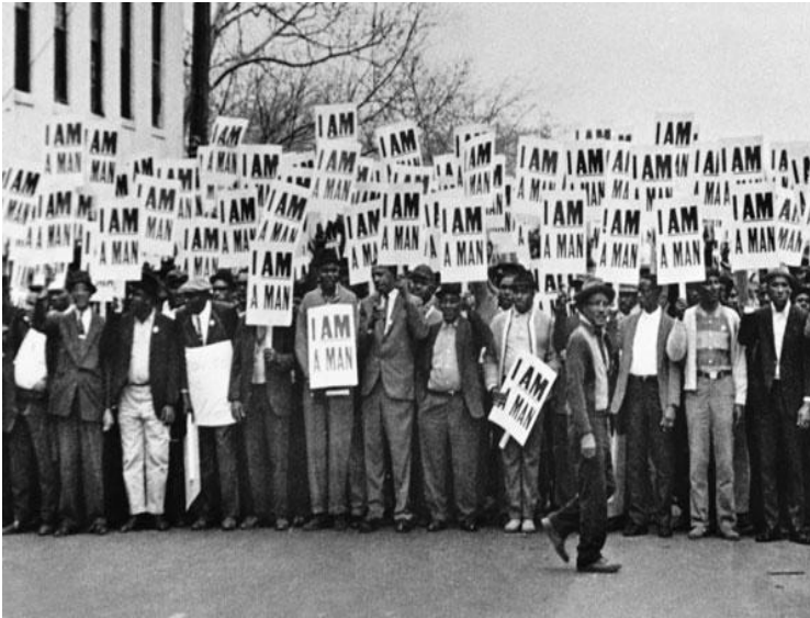
Población afroamericana en manifestació. En els cartells posa: "I AM", deixant clar que estan orgullosos de ser el que són.

l'amor. Eren coneguts per ser viatjants indefinits, sense cap destí. El moviment més important protagonitzat per aquest conjunt de persones va ser la reivindicació del desallotjament de tropes a la guerra de Iraq. Després d'una dècada més, apareixen els punks. Aquests, tot el contrari als hippies, eren rebels: estaven en contra del sistema, eren anarquistes, etc.