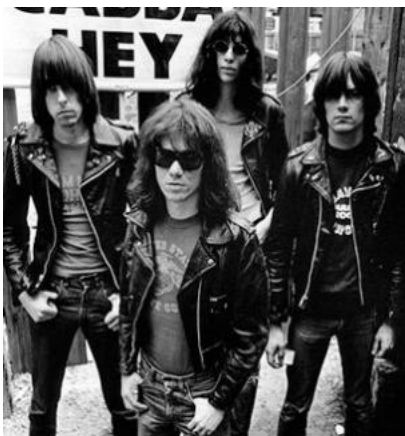
The Ramones, pares del punk.