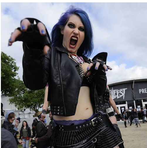
Aíxí van vestits els metal·lers: jaqueta de cuir, punxes i cinturons.