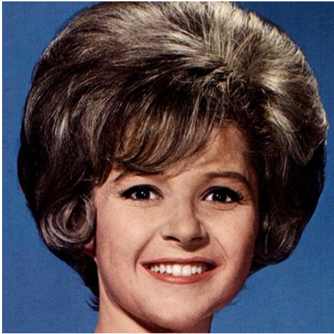
Brenda Lee, una de les primeres veus femenines del pop.