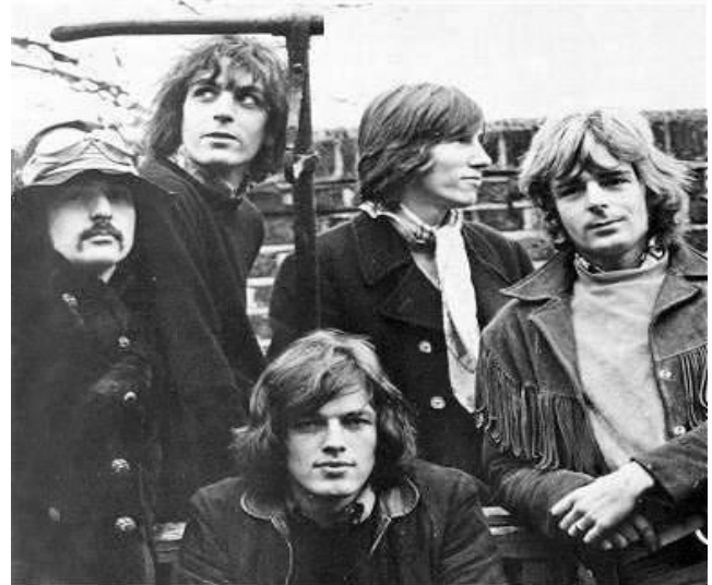
Pink Floyd, principal impulsor del moviment del rock espacial.