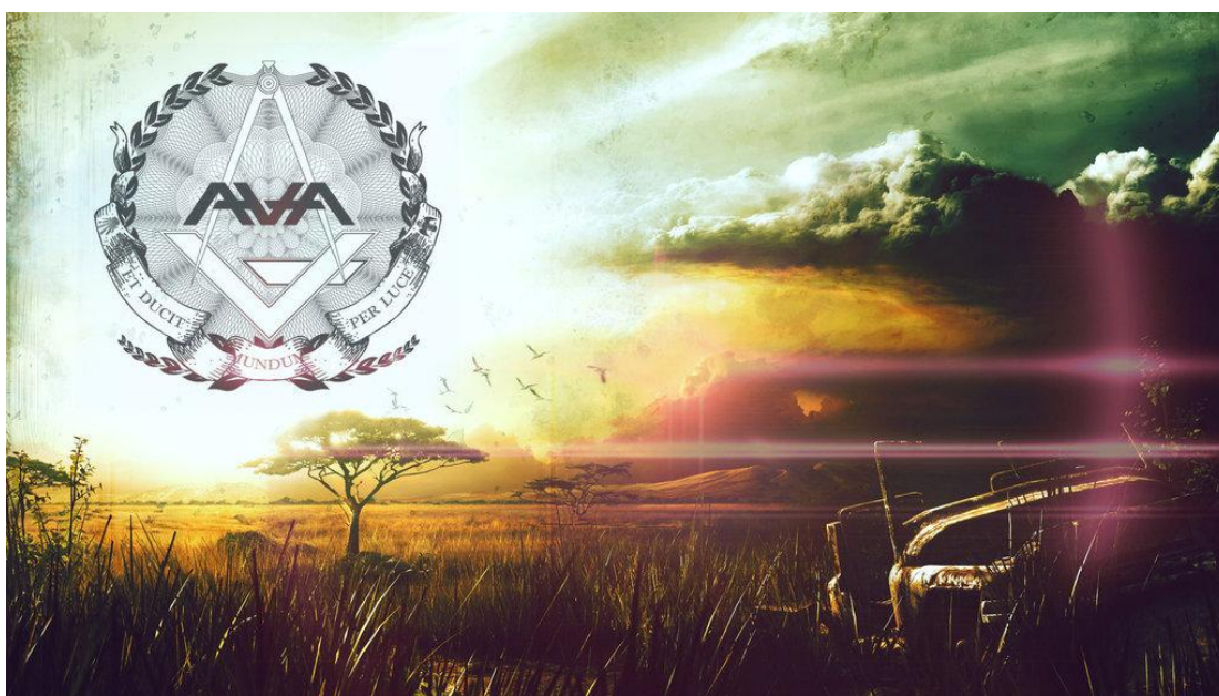
Imatge del logotip d' Angels and Airwaves on hi ha la famosa citació de Et ducit mundum per luce , la qual amb llengua llatina significa El món a través de la llum .

Per últim, el què més curiositat i interès presenta és la utilització de paraules tan curtes i tan repetitives al outro (part final d'una cançó) com és, en aquest cas “please stay, don't go, I got you now...” i l'oració que tant li agrada a Delonge: “Here I am”. El argument que es podria adherir millor a aquest misteri és donar-li musicalitat i rellevància a aquestes parts les quals donen una bellesa i un caràcter repetitiu molt harmoniós.