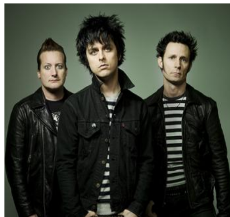
Green Day, grup de la nova onejada i dels pocs grups que plena estadis de futbol sencers.