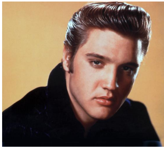
Elvis Presley, llegenda del rock.