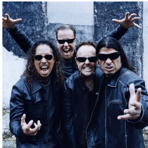
Metallica, els reis del metal.