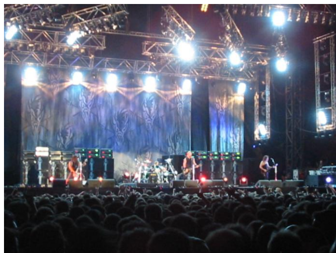
Concert de Metallica presidit per heavys.