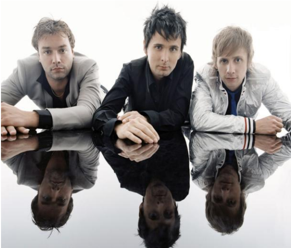
MUSE, un dels grups amb més èxit de la història.

purpurina, de colors llampants i estrafolaris, així com complements poc comuns (ulleres 3D, antenes de radiofonia, edificis avantgardistes...). Certament, és fàcil identificar un grup de rock espacial si es té unes pautes i unes bases musicals, el complicat i difícil és saber quines són aquestes característiques. En aquest cas, MUSE es considera un grup que conté elements del rock espacial, així com Pink Floyd 8 o Depeche Mode 9 .