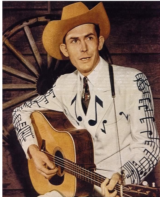
Hank Williams amb la seva famosa americana blanca de notes musicals