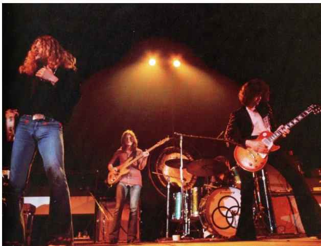
Led Zeppelin en plena actuació.