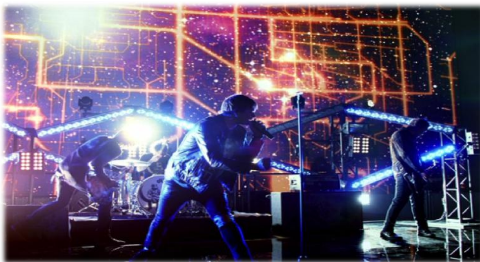
Imatge del videoclip de Anxiety : el ús de il·luminació i efectes brillants resalta el seu tarannà espacial.

En definitiva, amb aquests comentaris d'algunes de les cançons més importants del grup hem conclòs amb el fet de ser considerats un grup de rock espacial, ja que això només és una etiqueta. També se'l podria considerar un grup de rock alternatiu o qualsevol subgènere més. També podem veure com l'evolució del grup acaba amb temes cada vegada molt més espacials, a diferència d'altres grups iniciats i etiquetats en un primer moment com a space-rock que han acabat fent temes totalment diferents al que fa el rock espacial. També podem veure una evolució en la maduresa del grup, travessant així moltes figures retòriques i recursos estilístics que han acabat per donar-los-hi un caràcter molt més “espacial”.