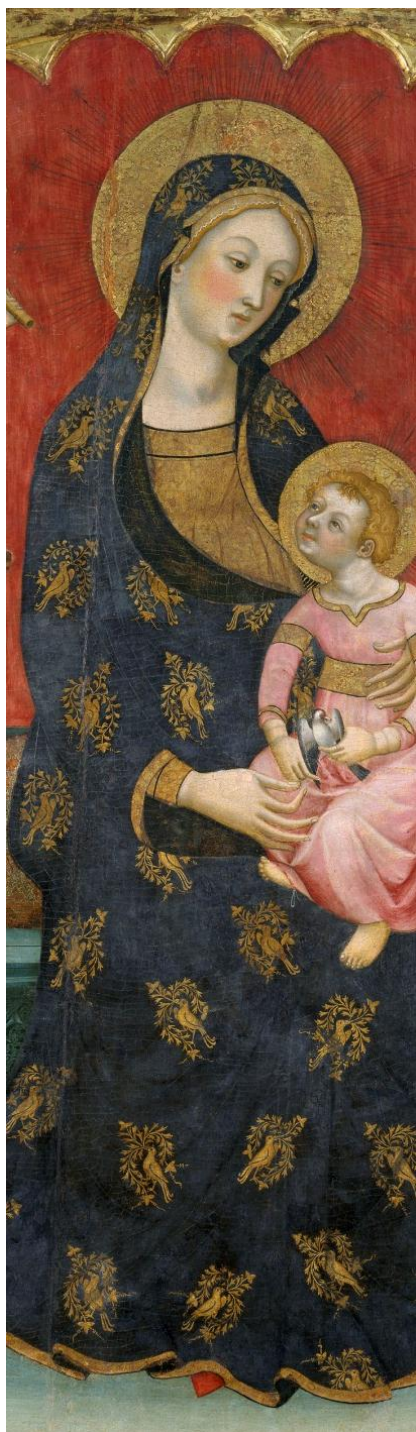
Fragment de la Verge dels Àngels.

Només començar la lectura, a la primera pàgina abans de començar la història, ja ens trobem amb la primera figura femenina. A l'inici, l'escriptor s'encomana i li dedica la narració a Déu i a "la sacratíssima Verge Maria, mare sua, senyora nostra [...]" la qual cosa ens mostra per les moltes vegades que s'esmenta a la verge, que ens trobem en una època molt mariana, ja que es fa tanta referència a ella o més inclús, que a Déu o Jesús al llarg del llibre. També les dones i donzelles suplicaven a "la sacratíssima mare de Jesús" perquè donés victòria al seu rei (Guillem de Varoic) contra el rei moro, al igual que la comtessa que tenia una oratori al seu retret on era la Mare de Déu .