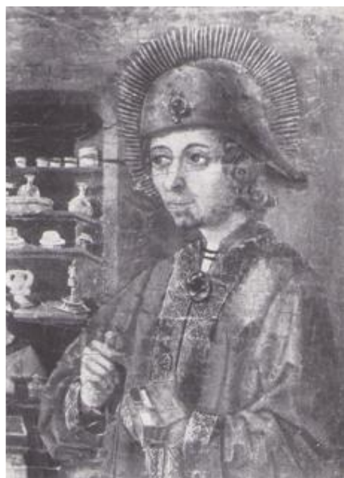
Retrat de Jaume Roig

Fill de metge, ell també ho va ser, i va gaudir d'un gran prestigi en aquesta professió. El seu prestigi social, heretat de la família, i la seva competència professional el van portar a ser metge de la monarquia, del municipi i dels estaments religiosos de la seva ciutat natal. El contacte amb els malalts a les cases, als monestirs, als convents i al mateix carrer explica la familiaritat amb què apareixen retratats en la seva obra els