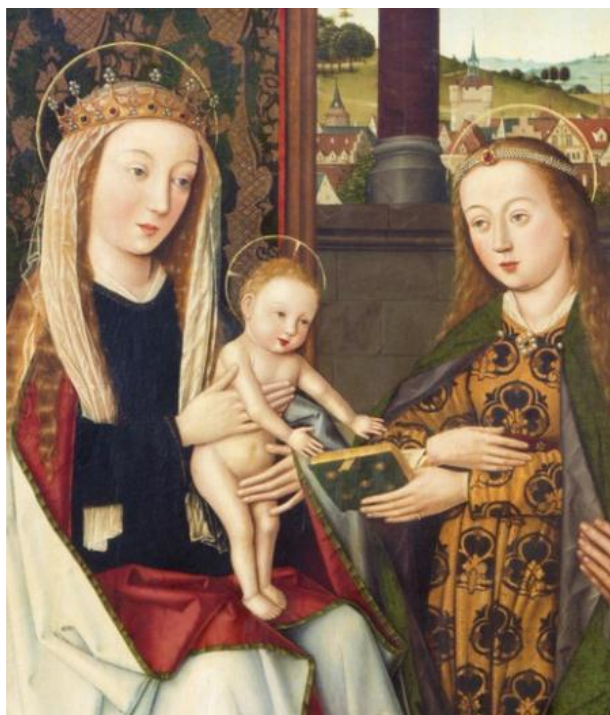
Fragment d'una pintura del s. XV

Unes celles poc espesses i ben definides sobre uns ulls rodons i brillants. En el centre de la seva blanquíssima cara un nas prim, i sota d'aquest uns llavis vermells amb unes dents molt blanques, petites i espesses.