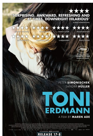
(Pel·lícula dirigida per Marde Ade amb la qual rep diversos premis)

Al cap i a la fi, totes aquestes qüestions són manejades per la gent que administra l'economia de la indústria cinematogràfica. “La indústria comercial el que pensa és en fer diners i no tenen cap interès en trencar esquemes de la dona.” I d'aquesta situació tenim exemples que no ens queden tant lluny del present que il·lustren molt bé la situació actual en la qual encara ens trobem. La directora em posa el següent exemple: “Aquest any per exemple, Maren Ade directora de la pel·lícula “Toni Erdmann” ha sigut la primera dona directora en guanyar el premi a la millor pel·lícula del European Film Awards i el premi FIPRESCI (premi que es donat segons la crítica). Que això no hagi passat fins el 2016 vol dir que alguna cosa esta funcionant malament. És evident que em guanyat coses però encara ens queda molt camí per endavant.”