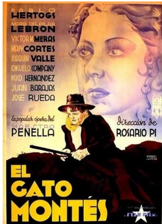
(Portada de la pel·lícula El Gato Montés )

El cinema de Rosario va seguir la línia de les comèdies i sarsueles que volien arribar al gran públic. Un cinema d'evasió en els convulsos anys de la República, que fugia de mostrar la realitat i els conflictes socials que dominaven aquells anys. Era en definitiva, la mirada de la burgesia conservadora.