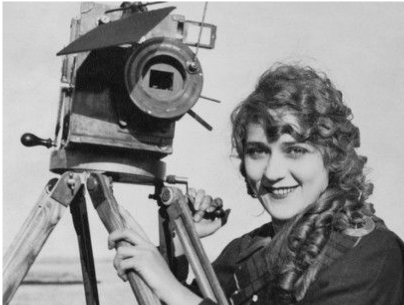
(Alice Guy, primera persona en fer una pel·lícula de ficció)

(el Sr. Gaumont), “jo crec que aquest invent no ha de servir només per retratar la realitat sinó per explicar històries”, per tant la primera vegada en el món que algú va fer una ficció va ser una dona, i això no ha quedat documentat.”