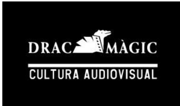
(Icona representativa de l'organització Drac Màgic )

Una organització pionera amb l'objectiu de portar el cinema a les escoles, dedicada fonamentalment a l'estudi i a la divulgació de la cultura audiovisual i la representació de les dones en els mitjans de comunicació audiovisuals. Hi han hagut moltes escoles que durant anys les han contractat per portar als nens al cinema. Dins aquesta organització es va crear un Festival anomenat "La Mostra Internacional de Cinema de Dones" actualment amb molt de prestigi. Aquest festival té la intenció de cuidar el cinema fet per dones i mostrar al públic els seus treballs.