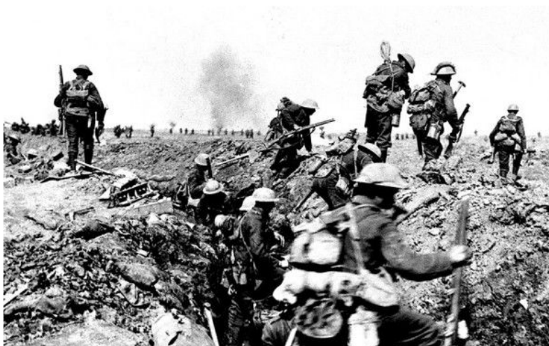
(Imatge de la Primera Guerra Mundial)

La primera etapa va ser des de mitjans del segle XIX fins a mitjans dels anys 20 i 30 del segle XX. Algunes de les raons que expliquen aquest retard per començar un camí cap a la igualtat de gènere són les següents. El desenvolupament industrial pobre que hi havia al territori espanyol, el model liberal que s'imposa després del Antic Règim, i el paper rellevant que juga l'Església Catòlica. L'Església s'encarregava en exclusivitat de l'educació de les classes benestants, potenciant les diferències entre els dos sexes i assignant les dones al rol d'esposa i mare. Tot això unit a les altes taxes d'analfabetisme femení i l'escàs accés al mercat laboral va retardar el desenvolupament del moviment feminista a Espanya.