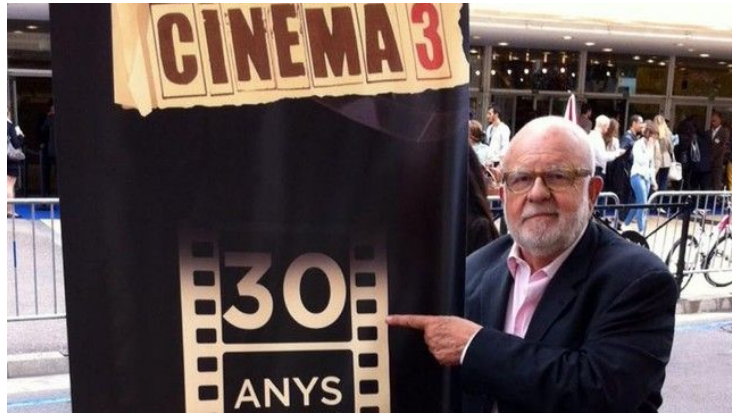
(Cinema 3 programa del canal 33 de la Televisió Catalana que va finalitzar el darrer any 2016)

D'altra banda, comencem a parlar sobre que és realment ser dona i directora alhora i totes les dificultats que això comporta. Em comença afirmant que ni ella mateixa coneixia aquesta part de la història dins el cinema. “Jo tampoc era conscient d'aquesta informació que t'he explicat respecte les dones directores, no sabia que un cop dins aquest món ens tornàvem invisibles.”