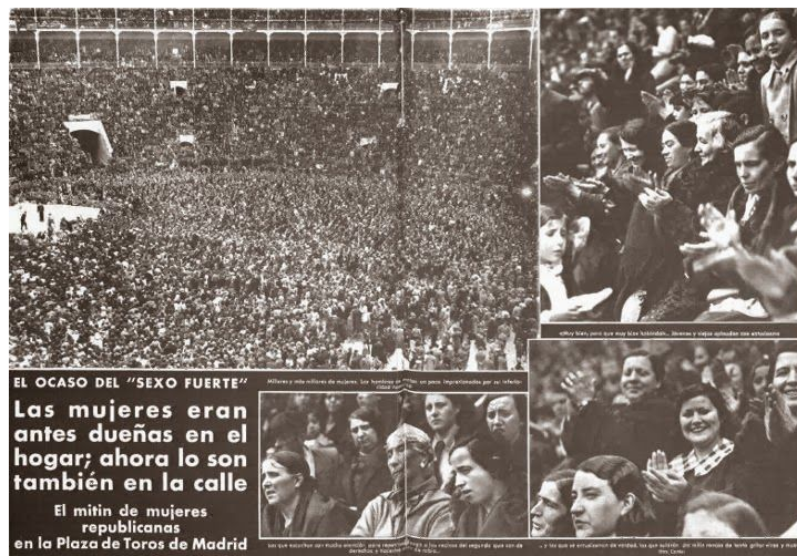
(Primeres Jornades per l'Alliberament de la Dona, Madrid 1975)

raça o postura política a la qual s'adscriu. Cal destacar també, que aquell mateix any, va ser l'Any Internacional de la Dona assenyalat per l'ONU. Fent que a Madrid s'organitzessin les Primeres Jornades per l'Alliberament de la Dona, on es va exposar un programa de denúncies i reivindicacions, entre les que destaquen la despenalització de l'adulteri femení, la legalització del divorci i dels anticonceptius, l'equiparació laboral i salarial, etc.