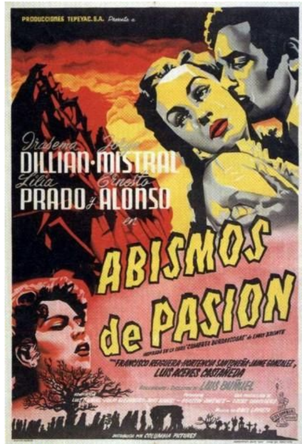
(Cartell de la pel·lícula “ Abismos de Pasión ”)