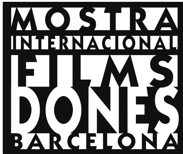
(Festival de cinema associat a Drac Màgic , La Mostra Internacional de Films de Dones)

"A partir, d'aquest Festival, jo vaig conèixer la història de Alice Guy que fins ara no en tenia ni idea."- em diu ella.