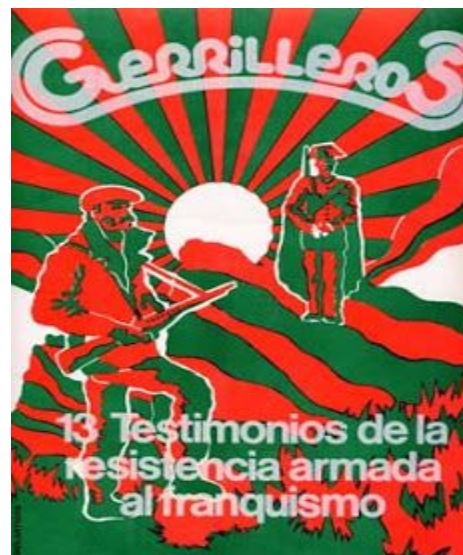
(Documental dirigit per Mercè Conesa)

S'ha de mencionar, que al menys per la informació que tenim, Lumbreras no va néixer al territori català i de Mercè Conesa no ho sabem per la manca d'informació disposada, però probablement era catalana. Però si sabem que aquestes dues cineastes van desenvolupar gran part de la seva trajectòria cinematogràfica a Catalunya, i que els seus projectes alhora tracten molt àmpliament la situació de Catalunya i Espanya en aquella època.