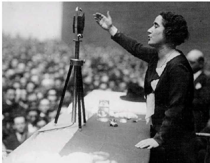
(Clara Campoamor, advocada i diputada del partit Radical. Va defensar el sufragi femení en el debat de les Corts Constituents de la República)

No va ser fins a la dècada del 1920 que es potencia l'activisme polític feminista i un interès en repensar els conceptes de ciutadania i democràcia, fent una reivindicació directa del sufragi femení. A la II República (1931-1939) el moviment feminista espanyol adquireix molta força. La situació econòmica precària, per l'absència del cap de família, van forçar a les dones a tenir una feina laboral, però alhora això va desenvolupar la seva independència. Les dones van exercir tasques d'ajuda de tot tipus, des de treballar en fàbriques de confecció fins a la permanència al front de les guerres. L'any 1933 la dona va aconseguir el dret al vot, el dret al divorci i la potestat sobre els fills, així mateix la dona es comença a fer visible al carrer i en la vida pública, com mostra la presència a les Corts d'algunes diputades (exemple: Clara Campoamor). En aquest sentit dins de l'Espanya republicana, moltes dones van valorar positivament la incorporació a la feina fora de la llar, trencant amb les tasques que els eren imposades fins aquell moment.