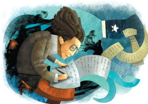
Ilustración 7: Representación de Antonio Gramsci, escribiendo sus 32 Cuadernos de la Cárcel