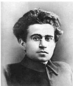
Ilustración 4: Antonio Gramsci en 1921

Para mantener esta sección fiel al proyecto y evitar irme por las ramas, cada sección de las tres va a constar de una breve biografía de cada pensador citado que, mediante finas pinceladas, va a acabar mostrando un boceto de lo que fue o es dicha persona. La segunda parte de cada sección va a tratar sobre lo que más importante es para este proyecto que es la síntesis de los pensamientos y reflexiones de los filósofos expertos propuestos después de una búsqueda exhaustiva de opiniones que completen esta investigación.