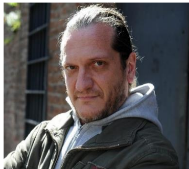
Ilustración 4: Imagen del filósofo argentino Darío Sztajnszrajber