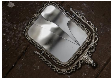
Mirall trencat de Dani Valle.

a recórrer la casa, de dalt a baix. Quan el mirall es trenca, entra en un món on tots els secrets de la casa queden enllaçats entre si però cap d'ells conté la veritat absoluta. Cadascun d'aquests bocins reflecteix el punt de vista d'un personatge important de la casa. “Les miques de mirall, desnivellades ¿reflectien les coses tal com eren? I de cop a cada mica de mirall veié anys de la seva vida viscuda en aquella casa. [...] Una orgia de temps passat, lluny, lluny...” (p.338) En aquesta mateixa al·lucinació, se li fan presents totes les persones mortes de la casa. Amb la copa alçada amunt, fa una ofrena a tots ells i s'adorm. “Tancà els ulls, sola amb el seu dol violeta, mig perduda en el pou del temps.” (p.341)