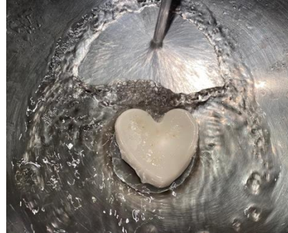
Un cor de sabó dins una pica.

a la posta.” (pàg.310) El Miquel Masdéu, el seu primer amor de veritat, havia estat la descoberta de la vida “ el primer petó tingué gust de menta, de vida ” (pàg.313) i el començament d’una petita rebel·lió; arribava sempre tard a casa i començà a faltar moltes tardes a brodar. La seva mare la castigava tancant-la els diumenges a casa, intuïnt el que passava. La Teresa, però, se les enginyava per poder-se saltar la custòdia i volava pels carrers. Quan parlaren seriosament del casament, el Miquel li explicà que ell ja tenia família i la Teresa quedà destrossada . “ Passà la nit plorant. S’havia volgut morir. Per sempre. Es veia pels carrers, abraçada a Miquel Masdéu, amb el cel rosa, amb el cel blau, amb estrelles, sense estrelles, amb ales als peus, transportada... Mai més. ” (pàg.315) Més endavant, l’intent d’amagar aquest amor li comportà la pèrdua de la seva joventut i el començament d’una nova vida melancòlica. “ El cor de sabó s’havia fos i l’aigua havia quedat tèrbola. La llençà aigüera avall. Tingué plena consciència que acabava de llençar la seva joventut. ” (p.319)