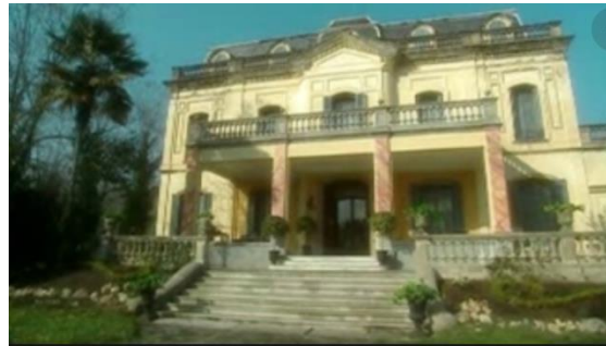
Torre dels Valldaura a la sèrie televisiva Mirall Trencat de TV3.

Després de llegir el testament, Sofia sent una gran decepció i enuig en contra del seu pare perquè la torre familiar és atorgada a la Teresa. “ Fins a la matinada, ella, que s’havia convertit en una de les noies més riques de Barcelona, plorà de ràbia i de vergonya perquè el seu pare l’havia enganyada. ”