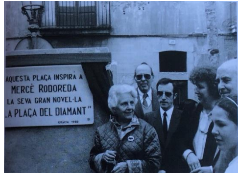
Mercè Rodoreda, el 1980, a la inauguració de la nova plaça del Diamant del barri barceloní de Gràcia.

És així com el 1962 publicà La plaça del Diamant . Durant més de mig any, va estar treballant amb la novel·la. Quan l'acabà, tingué la sensació d'haver escrit un gran llibre però dubtava de la reacció que podria tenir el públic. “ Si sabéssiu el que jo em vaig divertir escrivint-la. L'humor de La plaça, que n'hi ha molt, és el meu humor. [...] A La plaça es comença rient i s'acaba plorant. Hi ha un canvi de to involuntari. Vaig passar del còmic al greu. Quan me'n vaig adonar, em va fer una por terrible. Pensava «A veure si no encaixarà...» ” 22 Tanmateix, decidí no encaparrar-s'hi i l'editorial Club dels Novel·listes publicà la primera edició, d'uns dos mil exemplars, que no s'exhauriren fins al cap de dos anys. Al poc temps, però, els crítics començaren a interessar-s'hi i després vingué la traducció al castellà. “ Al final, La plaça del Diamant va arribar a ser això que es diu un best-seller. ” 23