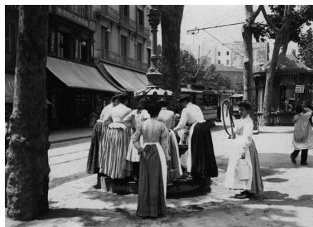
Grup de minyones recollint aigua a la Font de Canaletes, a principis del segle XX.