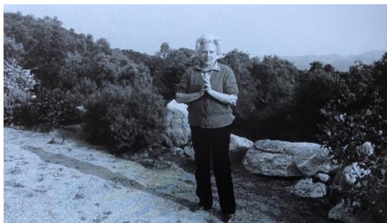
Mercè Rodoreda, a Romanyà de la Selva, el 1980.