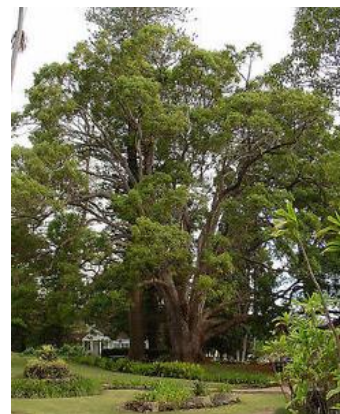
Fotografia d'un llorer frondós.

Després, la Maria entra dins la seva habitació. Allí, té una al·lucinació. Tota ella es queda nua, preparada per unes noces mortíferes. “Naixia nua d'onades mortes, amb una aliança damunt del cap, com una corona, metrallada de brillants i de robins. Els colors nupcials. El vermell de la virginitat esquinçada i el blanc de la virginitat d'abans. L'anell caigué.” (p.264) Ara és quan se li fa present el que vindrà més tard.