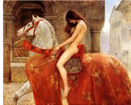
Lady Godiva de John Collier, 1898.