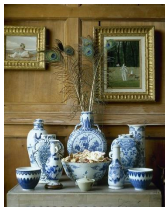
Gerro amb plomes de paó.

La mort d'en Jaume trasbalsa molt la Teresa. Com el dia en què Salvador Valldaura morí, la Teresa veu una tórtora a la finestra i intueix quelcom molt desagradable perquè ja n'havia sentit parrups el dia de la mort del seu marit. «Una angoixa sobtada li estrenyé el pit: el dia que Valldaura havia mort, una tórtora havia parrupejat a la finestra.» (p.186) Abans de ser enterrat, agafa una ploma de paó del gerro, d'aquelles que tant agradaven a en Jaume, i la deixa dins el taüt, com un símbol d'unió entre tots dos. «Tingui, senyor Jaume... ensenyi-la als àngels...» (p.189)