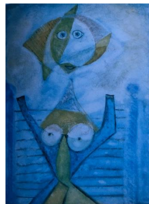
Dame aux mains coupées (Senyora amb les mans trencades), de Mercè Rodoreda.

Per poder-se refer, Rodoreda començà a interessar-se per la pintura i, setmanalment, visitava el Museu del Louvre, el dia que l'entrada era gratuïta. « Encara que semblava mentida, he passat més hores al Louvre que no davant el mirall. » Tanmateix, la seva salut física començà a empitjorar; una paràlisi al braç dret, que sembla que era psicossomàtica, la feu allunyar-se de la creació literària llarga i començà a escriure poemes. « Quan agafava la ploma, el braç em feia mal, els dits se m'encarcaraven, i la ploma saltava. Em va durar quatre anys. Va ésser quan vaig començar a fer versos. [...] A l'últim el mal em va passar tal com havia vingut. » 15 La pintura també va ser una manera de canalitzar el que pensava i sentia. La seva obra plàstica va ésser tan intensa com breu perquè no va durar més de deu anys, i la deixà de banda quan reprengué la seva activitat literària.