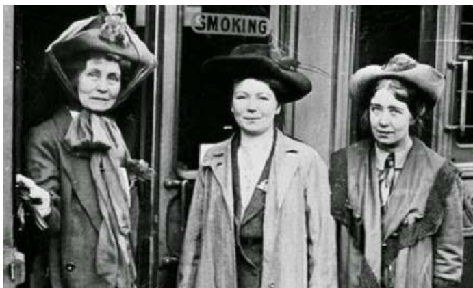
Fig. 4. Emmeline Pankhurst con sus hijas Sylvia y Christabel.

En 1898 Richard Pankhurst murió, esto supuso un gran golpe emocional para Emmeline, lo que hizo que se centrara más en la lucha política, acompañada, como ya se ha comentado antes por sus hijas Christabel y Sylvia.