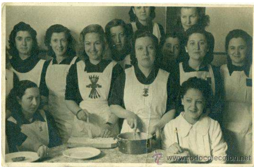
Fig. 13. Mujeres de la sección femenina de la falange

La Sección Femenina fue crucial en la maquinaria estatal del franquismo, ya que era el instrumento de control ideológico de las mujeres. El fin último de la Sección Femenina era difundir en el imaginario social la figura de la mujer como perfecto ángel del hogar, y pilar