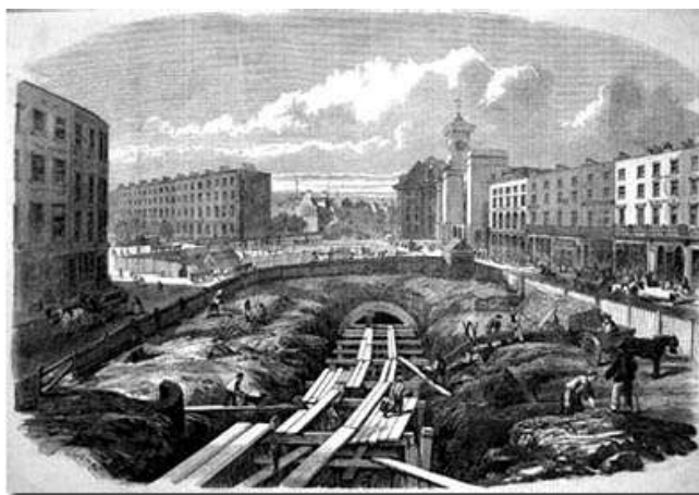
Fig. 1. Construcción metro de Londres

A causa de las nuevas técnicas agrarias muchos campesinos se quedaron sin trabajo en los campos europeos, lo que les llevó a desplazarse a las grandes ciudades a buscar nuevas formas de vida. Los avances tecnológicos fueron el punto clave para la revolución industrial, las antiguas formas de producción fueron