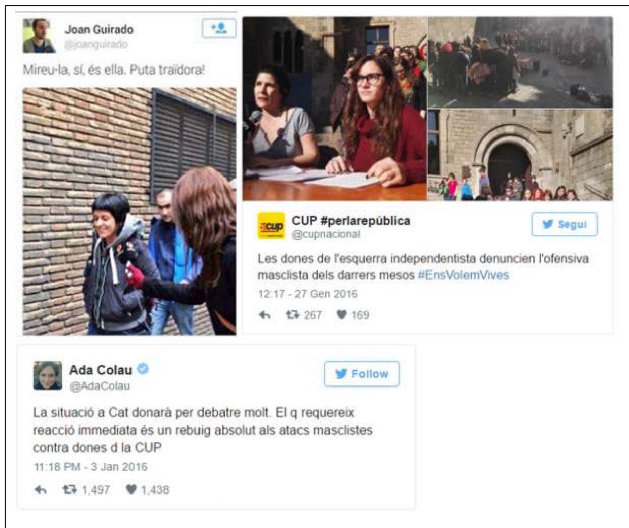
Fig. 14. Reproducció tuits originals.