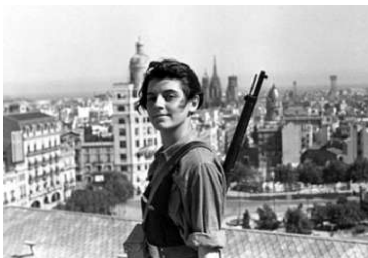
Fig. 10. Miliciana durante la guerra civil.

Los gobiernos de la República le confiaron otros cargos de responsabilidad, como la vicepresidencia de la Comisión de Trabajo, la dirección general de