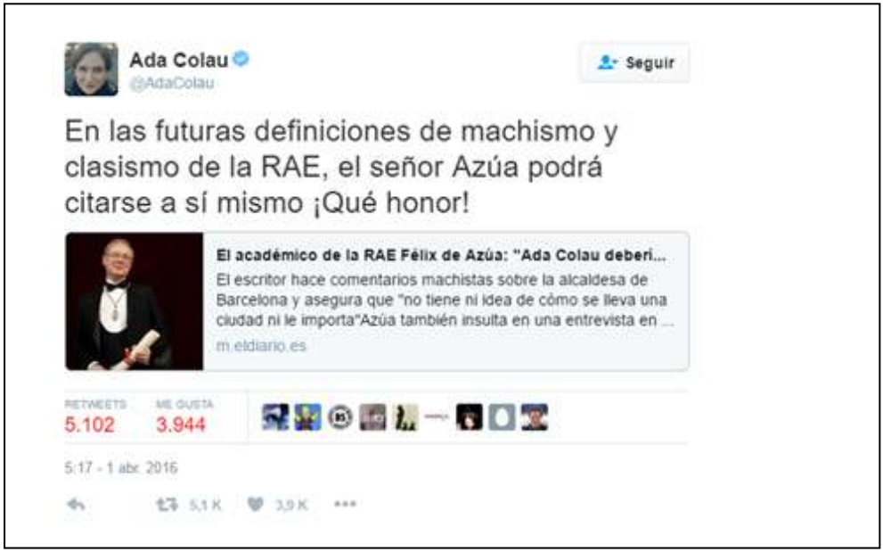
Fig. 16. Reproducción tuits originales