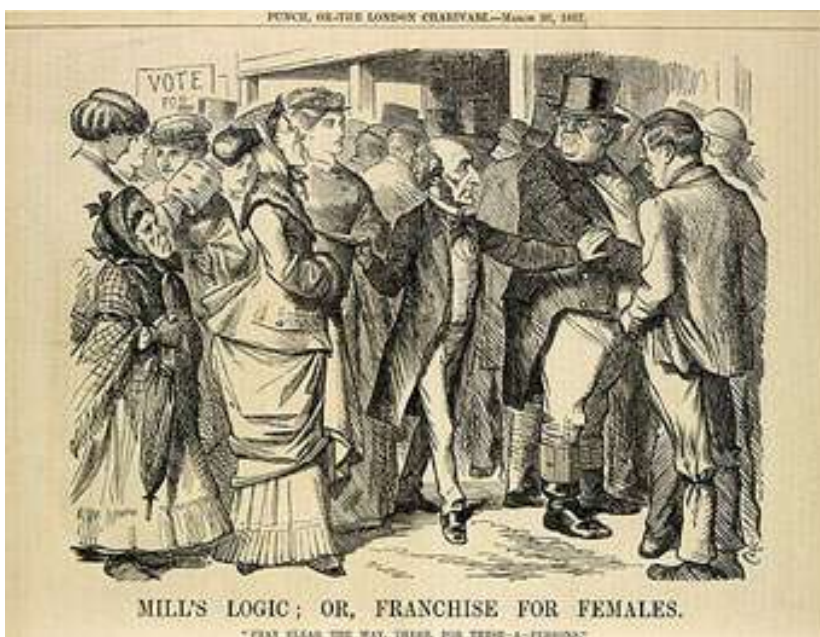
Fig. 2. Grabado de 1867 que satiriza a John Stuart Mill (en el centro) y en su pretensión de lograr el voto para la mujer.

Tras este periodo revolucionario Europa se sumergió en una época de reacción conservadora que repercutió directamente en la condición social y jurídica de las mujeres, esta reacción