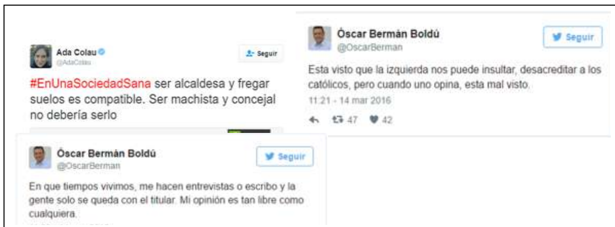
Fig. 18. Reproducción tuits originales