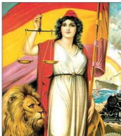
Fig.7. Representación de la Segunda República

El triunfo de las candidaturas republicanas en las ciudades más importantes de España dio paso a la Segunda República, debido a que el rey Alfonso XIII, que se encontraba aislado y sin apoyos entre los ciudadanos, se viera obligado a exiliarse el 14 de abril de 1931, dando paso así a la proclamación de la Segunda República. Acto seguido se formó un gobierno provisional formado por grupos de izquierdas, derechas, nacionalistas y socialistas y presidido por Niceto Alcalá Zamora hasta que unas nuevas cortes constituyentes dieran forma a un