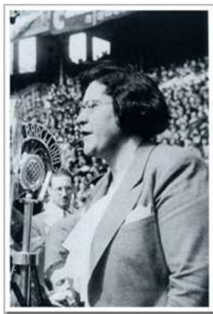
Fig. 12. Federica Montseny

Pasados los primeros meses de la Guerra Civil el papel de la mujer hizo un cambio radical, se llamó a las milicianas a su retirada hacia la retaguardia, la imagen de la miliciana desapareció de los carteles y empezaron a aparecer mujeres más tradicionales. Entre los argumentos empleados para la retirada de las milicianas estuvo su falta de preparación militar y fuerza física para realizar adecuadamente los ataques. Este hecho atendió también a la idea de que las mujeres no poseían, dado a su condición biológica, habilidades para la estrategia y las actividades bélicas, esta visión llegó a ser muy aceptada incluso entre las propias milicianas, que pasaron a dedicarse a las tareas típicas de asistencia social, a partir de ese momento las mujeres se convirtieron en las heroínas de la retaguardia, sus tareas iban desde trabajar en fábricas de munición, servicios sociales, campañas educativas y actividades de apoyo a los combatientes. Durante la guerra surge un interés oficial en que las mujeres ocupen cargos de responsabilidad, sobre todo en la asistencia social y por tanto, la dirigente anarquista Federica Montseny fue la primera mujer ministra en España.