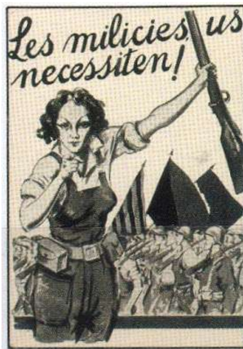
Fig. 11. Cartel de propaganda durante la guerra civil

La guerra civil catapultó a las mujeres españolas hacia nuevas actividades en el mundo político y social, en 1936 la figura de la miliciana (mujeres que ocuparon puestos en milicias republicanas) se convirtió en el símbolo de la lucha contra el fascismo. Aunque la mayoría de mujeres trabajaron en la retaguardia, solo unas pocas lucharon junto a los hombres. Algunas milicianas fueron destinadas a los frentes de Aragón, de Guadalajara, País Vasco, Madrid, etc. Las milicianas lucharon para defender los derechos conseguidos durante la República y demostrar