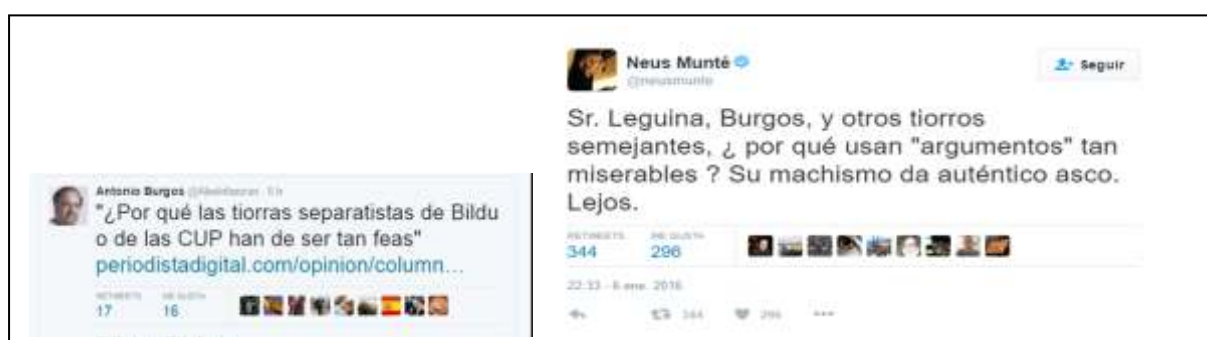
Fig. 15. Reproducción tuits originales.