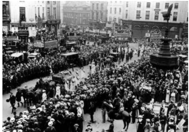
Fig. 6. Funeral a su paso por Picadilly Circus

El 14 de junio se celebró el funeral de Emily Wilding, este evento fue la ocasión perfecta para una de las manifestaciones más multitudinarias a favor del sufragio femenino. Muchas mujeres que no simpatizaban con las campañas de violencia llevadas a cabo por las sufragistas más radicales sintieron