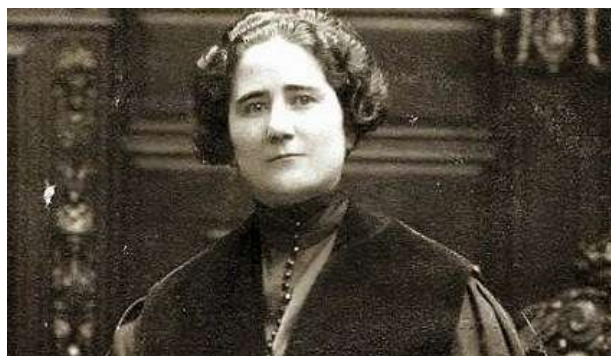
Fig. 9. Clara Campoamor y Rodríguez.