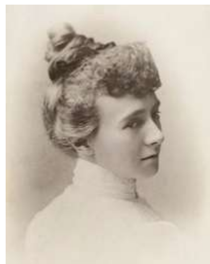
Fig. 5. Emily Wilding Davison

Emily dejó de estudiar y empezó a trabajar, primero como gobernanta y después como profesora en Edgbaston y Worthing. Gracias a dichos trabajos, Emily ahorró y pudo entrar en el Saint Hugh's College de Oxford. Allí estudió biología, química, lengua y literatura. Al finalizar sus estudios en Saint Hugh's College, donde obtuvo muy buenas calificaciones,