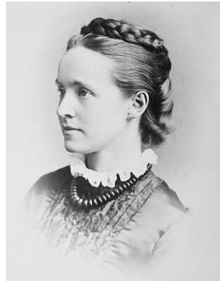
Fig. 3. Millicent Fawcet

Este grupo fue liderado durante más de veinte años por Millicent Fawcet, la cual fue escogida por los miembros de la sociedad, ya que esta era democrática, y tenía como objetivo lograr el voto femenino actuando según la legalidad y de forma pacífica. La labor principal de la Unión Nacional de Sociedades de