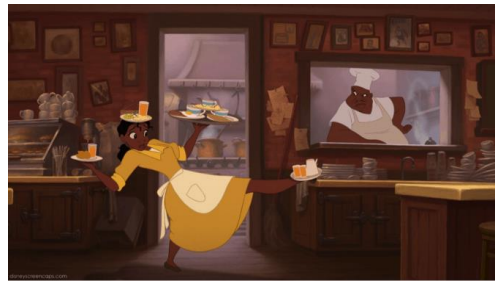
Imatge 7*: Tiana treballant al restaurant.