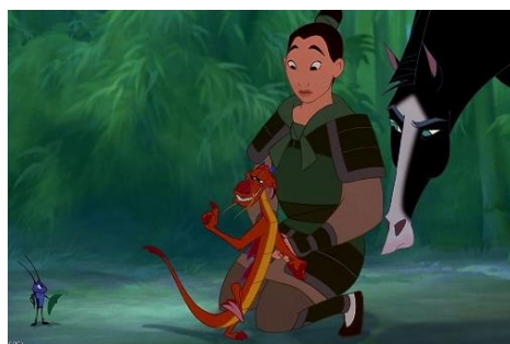
Imatge 16*: la Mulan disfressada d'home conversant amb en Mushu i en Crick-Kee.

L'objectiu de la jove al principi del film és enganyar amb la seva astúcia i enginy els guerrers xinesos per tal que no la descobreixin. A mesura que avança la història veiem com els seus interessos canvien cap a aconseguir la victòria contra els Huns, els quals venç en moltes ocasions gràcies a la seva vàlua personal i intel·ligència. És en aquest procés on descobrim el costat més guerrer i independent de la Mulan, el qual fa que al final de la pel·lícula salvi la Xina de la invasió dels Huns.