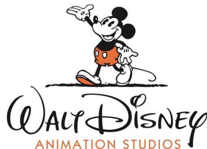
Imatge 1*: el logo actual de The Walt Disney Company .

Walt Disney junt amb Ub Iwerks, un animador estatunidenc que va col·laborar en el disseny del personatge d'en Mickey Mouse, van haver d'afrontar dos fracassos per així formar el que coneixem actualment com l'empresa d'animació Disney.