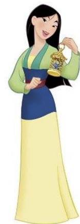
Imatge 15*: pla sencer de Mulan

Cal esmentar, que l'empresa d'animació en aquesta era del renaixement de Disney , va incloure nous cànons de bellesa orientals en les pel·lícules de Pocahontas (1995) i Mulan (1999). Tot i això, els trets facials de les protagonistes encara mantenen una caracterització molt occidental.