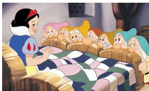
Imatge 11*: Blancaneus amb els set nans.

En primer lloc comentaré l'escena on la protagonista arriba per primera vegada a la caseta dels set nans i es troba totes les habitacions completament desordenades i brutes. Ella en adonar-se, immediatament diu: “¿Creéis que su madre...? (se asusta al pensarlo)