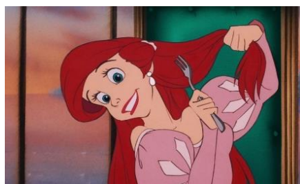
Imatge 14*: l’ Ariel empolainant-se el cabell

La Sirenita (1989) és una pel·lícula situada a la tercera onada feminista , que es coneix per ser un període on la dona s’interessa pels estudis per així optar a un treball. A conseqüència de la introducció en el món laboral, la natalitat disminueix i les feines domèstiques es comencen a repartir. A més, amb