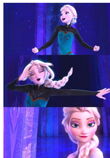
Imatge 23*: transformació de l'Elsa.

Mentre l'Elsa canta, experimenta una gran transformació que la canvia completament i reneix simbòlicament com a una nova persona. Aquest procés d'empoderament fa acceptar-la tal com és amb els seus poders i guanyar confiança en ella mateixa. Arriba al seu punt d'autorealització i a més, veu que té molta més força de la que es pensava.