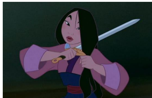
Imatge 17*: Mulan tallant-se el cabell.

En aquest fragment podem veure una notòria distinció entre les aptituds esperades en les dones (afecte, dedicació, servei) i els homes (valor, força, destresa). Cadascun d'ells ha de complir el seu rol per tal de no deshonorar la seva família, la qual cosa significa per a elles casar-se amb un home elegit per la matrimoniera 37 i per ells, representar el seu país en cas de guerra. Consegüentment Mulan, durant la cançó mostra una expressió facial de desconcert ja que sap que no encaixa en el seu entorn. Aquest sentiment de no pertinença augmenta més tard amb l'escena quan la jove canta Mi reflejo (11'28'') on mostra que el reflex que veu no és la imatge que ella ha escollit, ja que no vol casar-se i que mai no serà la filla que els seus pares esperen.