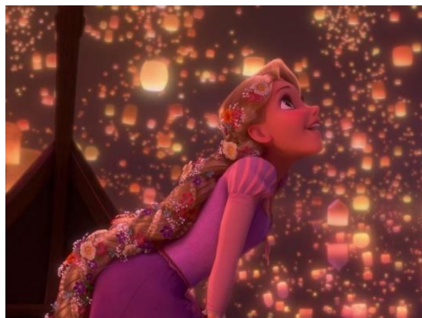
Imatge 20*: la Rapunzel complint el seu somni de veure els fanalets.

La pel·lícula Enredados , tot i ser un clar exemple d'un dels resultats obtinguts pel moviment feminista, no mostra cap símbol de sororitat, cosa que apareixerà més endavant amb Frozen (2013). Tot seguit, la protagonista posseeix en tot moment ple poder de decisió i conseqüència dels seus actes. A més, té un objectiu més enllà de l'amor, tret característic de les submises , i el seu desenvolupament personal no gira entorn un home, tret característic de les lluitadores .