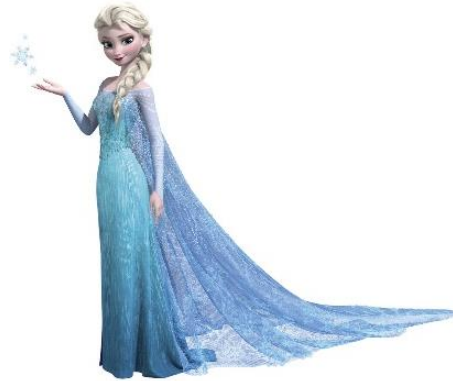
Imatge 21*: pla sencer de l'Elsa

La princesa Elsa és una jove de 21 anys que viu junt la seva germana menor de 18 anys anomenada Anna al regnat d'Arendelle, Noruega. La seva constitució és prima, té el cabell llarg ros platí i ondulat en forma de trena, els ulls grans i blaus, llargues pestanyes, el nas petit i allargat, la boca i les galtes rosades, la cara arrodonida i pàl·lida, és esvelta i té la cintura estreta.