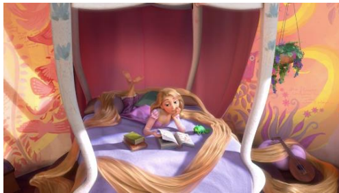
Imatge 6*: Rapunzel llegint al llit.

Seguidament podem observar que en aquests dos films les princeses tenen poder de decisió i conseqüència dels seus actes. Les característiques principals que se les atribueix són la consecució de somnis, la rebel·lia, l'ambició, perseverança, etcètera. Un exemple podria ser el caràcter autodidacte el qual posseeix la Rapunzel en estar tancada en una torre o les ganes que té la Tiana en voler obrir el seu propi restaurant. Malgrat tots els seus esforços, es veuran obligades a rebre l'ajuda d'un home perquè sense ells no aconseguirien els seus objectius.