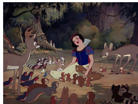
Imatge 5*: Blancaneus voltada d'animals

Un altre tema que cal tractar és com, a diferència del masculí, el personatge femení es mostra més en l'àmbit privat que en social. Fent sempre les tasques de la casa i voltada sempre d'animals, amb els quals es relaciona més que amb qualsevol altre personatge. Fins i tot els animals intervenen en les seves decisions, aconsellant-la o prevenint-la d'algun tipus de perill.