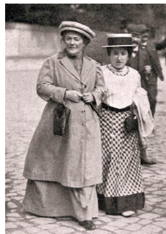
Imatge 8*: Clara Zetkin amb Rosa de Luxemburg.

Les dones en aquesta època van començar a ser activistes en la política i van aconseguir el dret a béns propis i al salari. També es proclamen lliure pensadores i sorgeix el concepte de l'emancipació de les dones 17 . En aquest període de temps les dones comencen a conduir, publicar i accedir a estudis superiors lliurement. Finalment el 1893, Nova Zelanda es declara com el primer país amb sufragi universal.