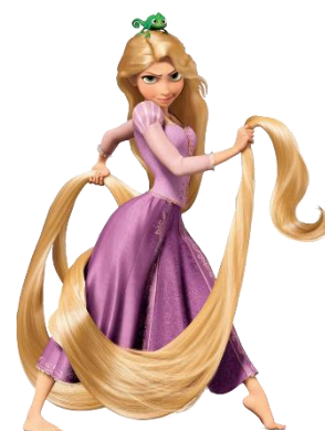
Imatge 18*: pla sencer de Rapunzel

Rapunzel és una jove en la pel·lícula compleix els 18 anys, té la pell blanquinosa, el cabell ros i llarguíssim, els ulls grans i verds, les pestanyes llargues, les galtes rosades, el nas rodó, els llavis naturals, el pit mitjà, és de complexió prima, té el maluc ample i la cintura estreta.