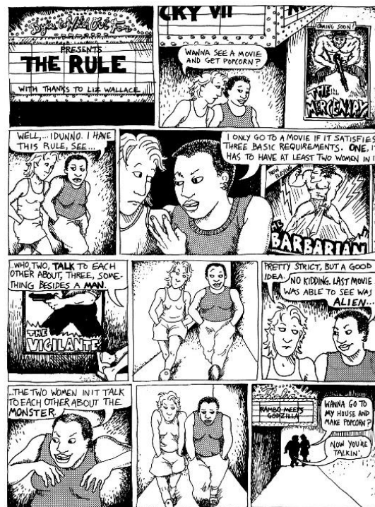
Imatge 9*: Vinyeta escrita per Alison Bechdel.

3. I en algun moment, han de tenir una conversa on la temàtica no sigui d'homes.