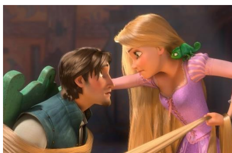
Imatge 19*: la Rapunzel lligant al Flynn amb el seu cabell.

En segon lloc, la Rapunzel demostra ser una jove decidida, forta i valenta atès que tot i no haver conegut mai cap ésser humà, més enllà de la Gothel, no dubta ni un instant en donar-li una clatellada a Flynn Rider amb una paella, pensant que volia ferir-la, després que es colés en la seva torre (19’30’’). I després de convèncer la seva mare perquè emprengui un viatge de tres dies (23’43’’), també es mostra impassible a l’hora fer-li xantatge per així veure els fanalets (28’04’’). En aquestes escenes, la protagonista mostra que, a més de posseir un gran poder de decisió i independència, no necessita la protecció de ningú.