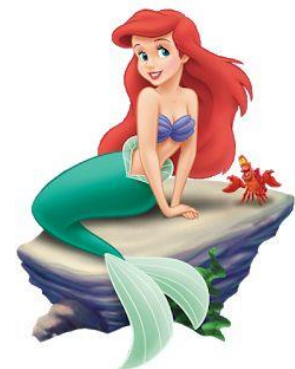
Imatge 12*: pla sencer de Ariel

La princesa Ariel és la germana menor de les set filles del rei Tritó. És una noia de 16 anys de pell blanquinosa amb la cara llarga i afilada, el cabell llarg ondulat roig, els ulls grans blaus amb llargues pestanyes, el nas i la boca petita, els llavis vermells i la veu melodiosa. La seva constitució és prima, té la cintura de vespa, el pit mitjà i una llarga cua de sirena de color verd blavós.