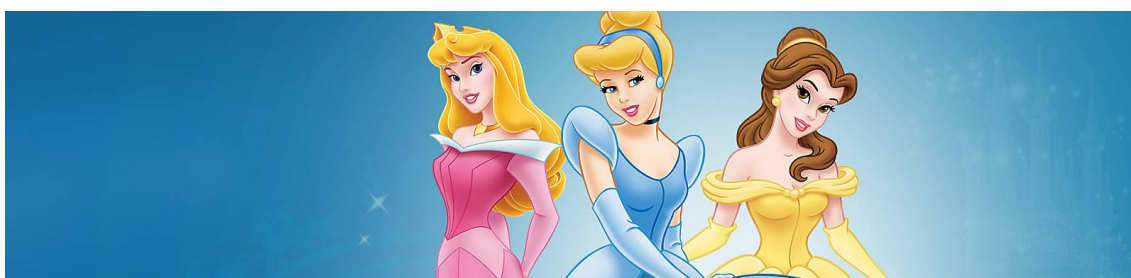
Imatge 4*: primer pla de les princeses Aurora, Ventafocs i Bella.

Com hem pogut veure abans, els rols de gènere són les suposades conductes que hauria de tenir cada sexe dins d'una societat, mentre que els estereotips són les imatges generalitzades que té un col·lectiu sobre un altre. Dit això, em dedicaré a comentar tots els rols i clixés marcats que la gran multinacional ha atribuït a les seves produccions. Molts dels estereotips fixats de la productora van venir acompanyats de la visió de la primera figura femenina, la Minnie. Gràcies a les aptituds i vestimenta que Disney la va atribuir en els primers curtmetratges, van servir de patró per a dissenyar les següents Princeses Disney.