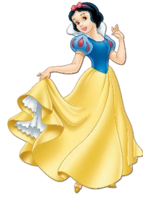
Imatge 10*: pla sencer de la Blancaneus.

A més de ser una noia atractiva, sap cantar melodiosament. Se la descriu com a una dona ingènua, pura, poc racional, innocent i guiada pels seus sentiments. Disney en aquesta pel·lícula ens ha volgut mostrar el seu ideal perfecte i tradicional de “dona”. És a dir, una noia eficaç en l'àmbit domèstic i sense cap mena d'ambició a part de trobar l'home dels seus somnis el qual s'enamora en pocs segons i l'entrega el seu cor sense ni tan sols conèixer.