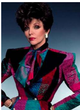
FIGURA. 27 Muscleres

Vestir una jaqueta amb muscleres era, molts cops, el look preferit de qualsevol dona de l'època. No era necessari que es portessin amb jaquetes, sinó que les vestien amb gairebé bé tot: bruses, camises, etc.