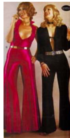
FIGURA. 25 'Granota' estil disco

El model més destacat va ser el que es va anomenar 'la granota', que era un tipus de roba molt acolorida i sobretot lluent. Era un conjunt de tota una peça, cenyida per tot el cos i acabada en pantalons de campana, tan destacats en l'època. Sovint anava acompanyat per un cinturó, que feia una funció únicament estètica.