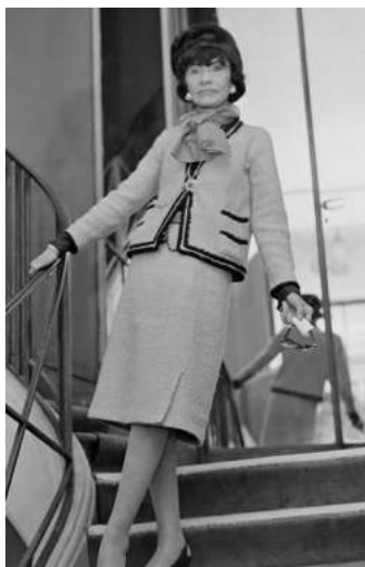
FIGURA. 14 Coco Chanel

convertir en un símbol de dona moderna i lliure. Va ser molt admirada pel gènere femení de l'època. Totes desitjaven ser “una dona flapper”.