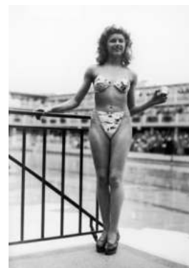
FIGURA. 17 'Biquini'

El biquini també va ser un dels majors descobriments d'aquesta dècada, gràcies a Louis Réard, un enginyer que va acabar sent dissenyador. Tot i que anteriorment mai s'havien banyat vestits, el biquini va ser la primera indumentària de bany que deixava al descobert el melic, i en aquests anys va ser quan es va acceptar que una dona ensenyés quasi per complet el seu cos.