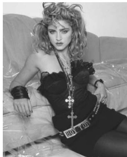
FIGURA. 28 Madonna

Va ser una dona que s'exhibia molt de manera totalment empoderada. Amb la seva actitud punk, captivava a totes aquelles dones que desitjaven ser tan diferents i revolucionàries com ella. Va posar molt de moda la llenceria com a vestimenta normal, cosa que mai s'hagués permès en una dona.