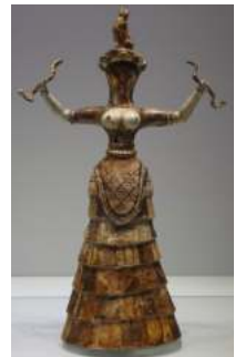
FIGURA. 10 Cotilla al 1600 aC

A diferència de la part superior, la faldilla era del més extravagant. Es buscava donar voluminositat al vestit. Per assolir-ho va sorgir el mirinyac que ajudava a assolir aquest volum.