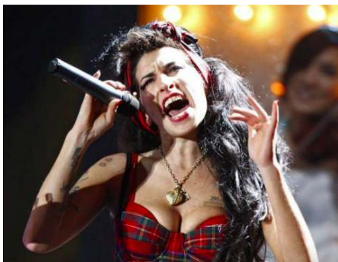
FIGURA. 21 Amy Winehouse

Amy Winehouse va ser una cantant que va ser anomenada la ‘reina pin-up’. Tot i situar-la als anys noranta, obtenia tots els trets d’aquest estil. Amb això ens adonem que la moda no és quelcom instantani, sinó que pot tornar en qualsevol moment. El que ressaltava en ella, van ser els tatuatges que portava, ja que era estrany en dones. També va ser recordada pel seu monyo, que era