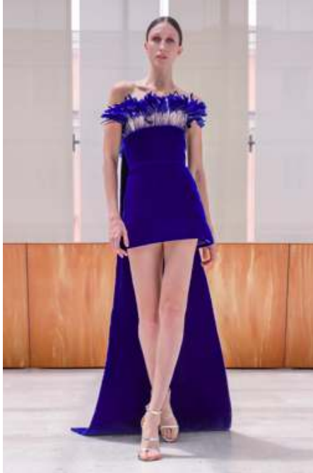
FIGURA. 3 Vestit alta costura, de Antonio Grimaldi