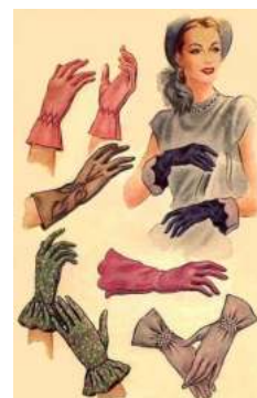
FIGURA. 12 Exemple guants