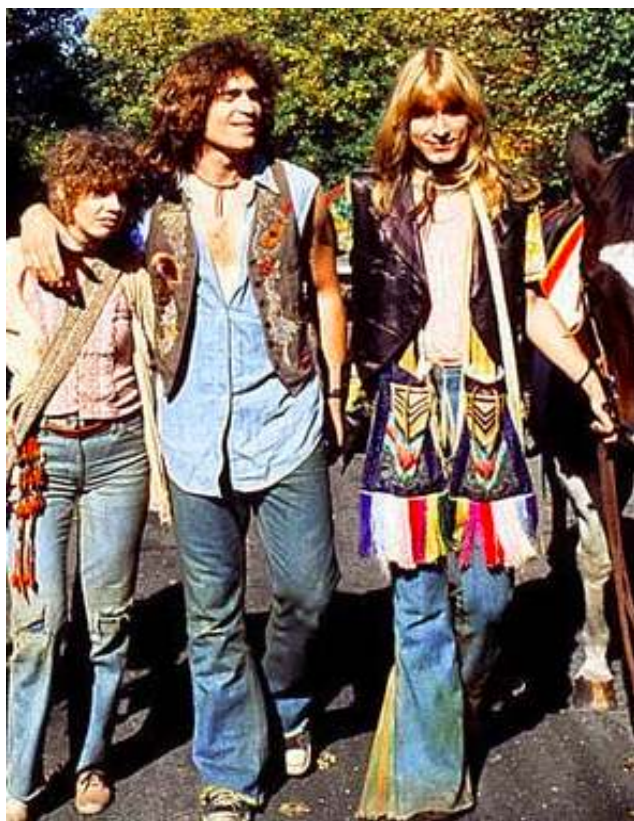
FIGURA. 22 Estil 'hippie'

d'ells havien anat a la guerra involuntàriament. Ajuntant això amb els valors conservadors que marcaven la societat del moment, els joves es van reivindicar, van deixar de costat el 'què diran de mi?' i van començar a cercar una vida més lliure. D'això se'n va anomenar estil hippie .