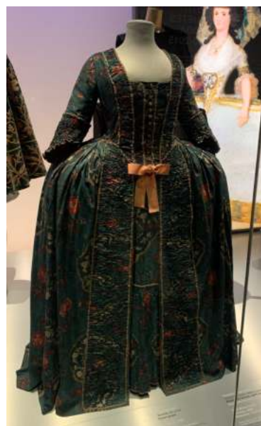
Vestit d'estil Rococó

Aquesta etapa va del segle XIV als inicis del segle XIX. Va ser l'època on la moda va ser molt reconeguda en l'alta societat, és a dir, la noblesa. Això va generar un descontentament entre la burgesia, i va provocar una lluita de classes on era molt important la seva indumentària. En aquell moment els burgesos eren gent que vivien molt bé, gràcies al seu esforç i treball, en canvi, els nobles tenien les mateixes riqueses, o fins i tot més, sense haver hagut de lluitar per tenir-les. Tot i això, els aristòcrates no volien que els burgesos tinguessin els mateixos luxes, la mateixa forma de viure, de vestir, etc. Per això la noblesa va fer les Lleis Sumptuàries. Van ser unes lleis que marcaven uns límits a l'hora de vestir per a la classe baixa. Bàsicament, no volien que hi hagués una igualtat social.