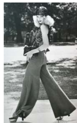
FIGURA. 24 Pantalons d'elefant

El peu d'elefant, bàsicament, són uns pantalons estrets des de la cintura fins als genolls, i des d'allà als peus, es van fent cada cop més amples. Va ser una tendència que es va popularitzar en aquella dècada i que avui en dia continua sent vestida en els carrers. Van ser vestits tant per homes com per dones.