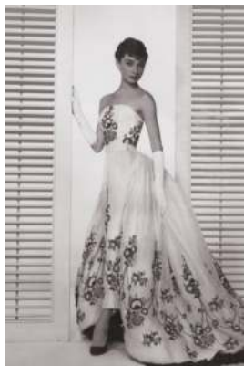
FIGURA. 20 Audrey Hepburn

"La elegancia es la única belleza que nunca desaparece. La belleza de una mujer no reside en los trajes que lleva, ni en su maquillaje, ni en la manera en la que se arregla el pelo. La verdadera belleza es un reflejo del alma". Aquestes paraules van ser dites per la icona de la moda més coneguda de tota la història, Audrey Hepburn. Va ser una actriu que va començar la seva carrera el 1951. A partir d'allà tots els ulls van ser posats sobre seu. Ella sabia perfectament com ressaltar les seves qualitats, i ho feia de manera natural i empoderada. És a dir, representava una dona segura d'ella mateixa i carismàtica. Tenia