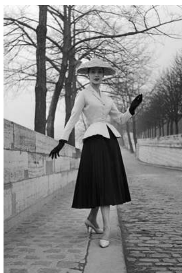
FIGURA. 18 'New Look'

Finalment, en acabar la II Guerra Mundial el 1945, hi va haver una alliberació per part de la societat.