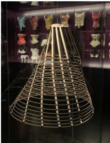
Mirinyac del segle XVIII