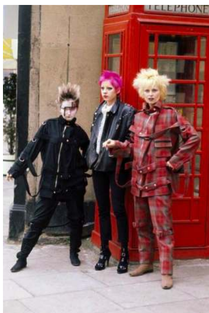
FIGURA. 26 Estil 'punk'

El moviment punk va sorgir com a subgènere musical del rock. Amb el seu estil volien expressar un altre tipus de societat completament diferent. Aquest sentiment es va reflectir a la seva indumentària. Vestien amb colors foscos, negres, grisos i alguns blancs per contrastar. També era molt usat el vermell, però principalment pels complements.