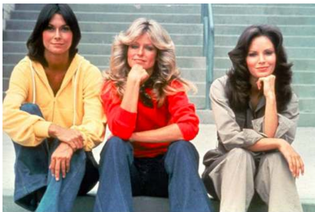
FIGURA. 23 Exemple indumentària anys setanta

Els colors llampants i els estampats de tota classe, que abans eren tot un escàndol, ara eren vestits per tots aquells qui els apassionava la novetat, és a dir, per la majoria de la societat. Les dones van