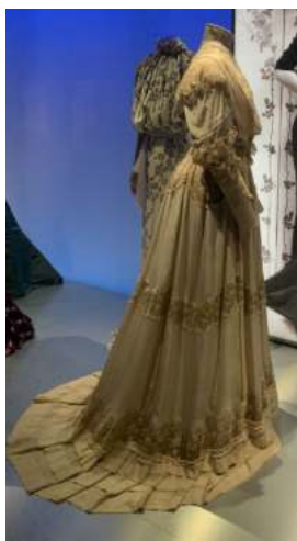
Vestit a la dècada de 1900

En relació amb el vestit, la part de la brusa va tenir una evolució al llarg de tota la dècada. Principalment, va tenir una forma bombada però cenyida per la cintura, i va finalitzar amb la part de les mànigues cada cop més estretes pels canells. El coll es caracteritzava per ser alt i amb molta voluminositat, tant que arribava a ser incòmode.