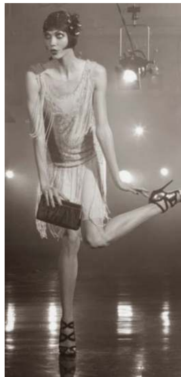
FIGURA. 13 Vestit Charleston de dues tires

Va ser una tendència on no hi va haver gaire diversitat, ja que per molt que fossin vestits o conjunts, eren pràcticament tots iguals. El vestit que va ser més famós consistia en un tall asimètric, dissenyat únicament amb un tirant i deixant una espatlla descoberta. Tot i que, per major comoditat també es portava molt el vestit de dues tires. El tall inferior era per la mida dels genolls.