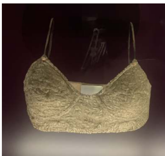
Sostenidor del 1914

Com ja s’ha comentat abans la guerra va provocar que les dones comencessin a treballar, per tant, els dissenyadors es van començar a centrar en la seva comoditat abans que en l’estètica. D’aquesta manera, van deixar d’usar-se les cotilles de forma diària i constant. Al llarg de la dècada es van anar escurçant fins a arribar al que coneixem avui en dia com a sostenidors. Aquest va ser el primer pas per deixar veure la silueta natural del cos femení, cosa que va provocar l’alliberació de moltes dones.