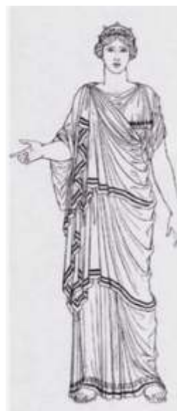
FIGURA. 8 Dona amb himantón