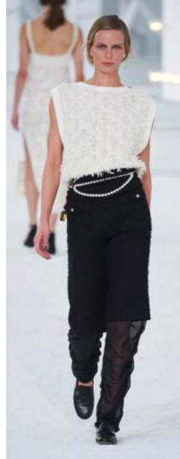
FIGURA. 4 Vesturari Prêt-à-Porter, de Chanel