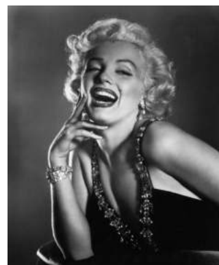
FIGURA. 19 Merylin Monroe

En la seva figura podem veure, literalment, totes les qualitats que una dona buscava. Arracades de perles, vestits preciosos que marcaven a la perfecció el seu meravellós cos, talons que estilitzaven encara més aquella figura tan desitjada, el cabell ros i sempre ben pentinat i un maquillatge ressaltant (sempre amb llavis vermells). La combinació de cabell ros i llavis vermells va ser molt popularitzat per ella, és a dir, va ser un exemple a seguir.