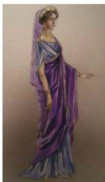
FIGURA. 9 'Stola'

L'antiga Roma era semblant a l'antiga Grècia en relació amb les teles i formes de les robes. La diferència principal era que els homes i les dones tenien peces de roba diferents. Aquí ja va començar a diferenciar-se l'estil femení del masculí. Mentre els homes duïen una túnica bàsica, elles duïen la 'stola', una peça de roba que era una mica més elaborada que la indumentària usada normalment, és a dir, estava més decorada.