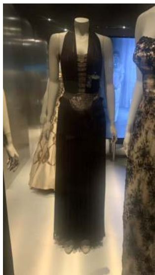
Vestit de nit als anys trenta

'tallatge biaix' era símbol del que es volia representar: era ajustat per la cintura per remarcar les faccions dels cossos, però deixant enrere la incomoditat de les cotilles. D'altra banda, l'altre model de vestit era el coll 'halter', el qual s'ajuntava per darrere la nuca de manera que l'esquena quedava descoberta i donava un toc picaresc i atrevit, i l'escot era molt pronunciat, tant que s'acabava a l'alçada dels pits, remarcant-los. Aquest model era el més elegant a les nits i moltes dones l'utilitzaven. Aquesta mateixa cerca de l'elegància va portar a allargar-se de nou els vestits fins al punt de no veure's les sabates, això també ajudava a l'estilització de la cintura.