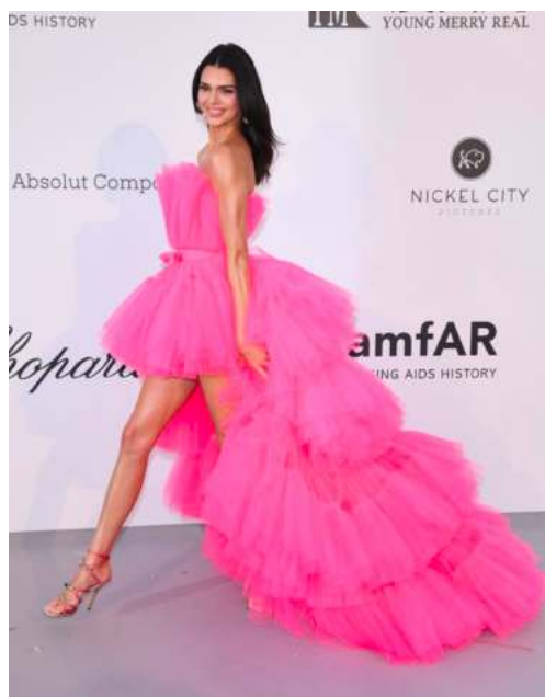
Kendall Jenner a la amfAR Cannes Gala

Per mi aquest disseny va ser la “base de la inspiració” pel meu vestit. Però, com podreu comprovar el vaig anar modificant fins a sentir-me'l com a propi.