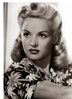
FIGURA. 15 Pentinat anys 40

En relació amb el cabell hi va haver un pentinat molt famós que lluïen gairebé totes les dones. Era considerat un pentinat perfecte. Caracteritzat pels seus rínxols definits i grans. Va ser protagonista entre les estrelles de Hollywood dels anys quaranta, i seguidament dels cinquanta. Era elegant i, com cada època, l'elegància feia l'efecte de gran riquesa i poder, creant així una idealització dels pentinats.