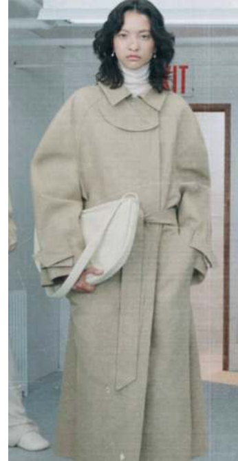
FIGURA. 5 Vestit mass market, de Zara