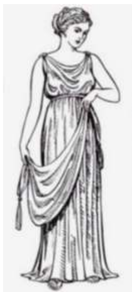
FIGURA. 7 Dona amb quitó i himantón