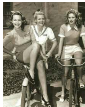
FIGURA. 16 'Short'

Com ja s'ha explicat abans, a causa de l'escassetat de teles i a la necessitat de comoditat de l'època, van sorgir els 'shorts', que van ser una gran innovació. Va destacar per la seva comoditat i la seva lleugeresa. Es combinaven amb samarretes i les sabates més populars, que eren les 'cuñas de yute', unes sabates descobertes i lligades per la part del turmell.