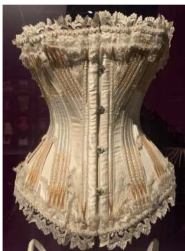
Cotilla de la dècada del 1900

Al principi de l’època la moda estava limitada per la idealització dels cossos. L’objectiu de les dones era lluir la silueta S, s’anomenava així pel fet que era coneguda com a ‘silueta de sirena’.