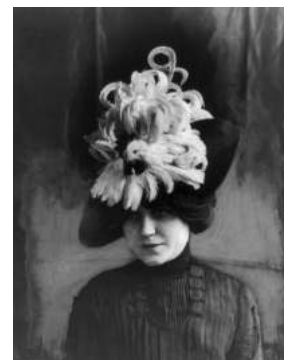
FIGURA. 11 Dona amb un barret fet de plomes d'ocells

Els guants eren una representació, com el barret, de riquesa i poder. Eren molt usats per la classe alta. No hi faltava cap detall en aquells guants tan sofisticats, ja que estaven decorats amb tota mena de volants, encaixos i joies. Com més exagerat, millor.