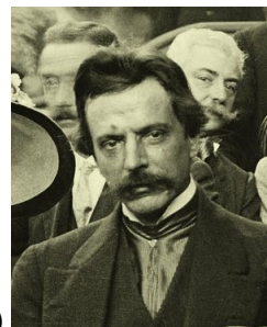
Enric Morera i Viura (Barcelona, 1865 – Barcelona 1942)

Abans de començar recuperarem la figura del seu autor, Enric Morera. També ressenyarem la lletra de la sardana del poeta Joan Maragall, tota vegada que en aquesta sardana, potser com en cap altra, lletra i música són part important d'un dels elements més representatius de la identitat i cultura catalana.