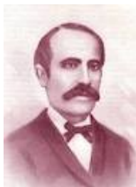
Pep Ventura, o Pep de la Tenora. Figura clau.

El pas de la sardana curta a la sardana llarga té com a precursor a Pep Ventura (1817 – 1875), que reformà l'estructura musical, i també reestructurà i amplia la cobla. L'estructura de la sardana va passar a ser una composició lliure amb uns límits d'extensió que oscil·laven entre els vint-i-cinc i els quaranta compassos en els curts i els seixanta – vuitanta en els llargs. La Sardana Llarga es va anar propagant per l'Empordà i la Selva, i des d'allà a tot Catalunya arribant també a Barcelona. Amb motiu de les festes de la Mercè del 1871, en la programació del cartell es detallava: "empordanesos ballen sardanes llargues al so de la cobla", i en el de l'any següent figurava la cobla de Pep Ventura "tocant contrapassos, sardanes llargues i altres balls".