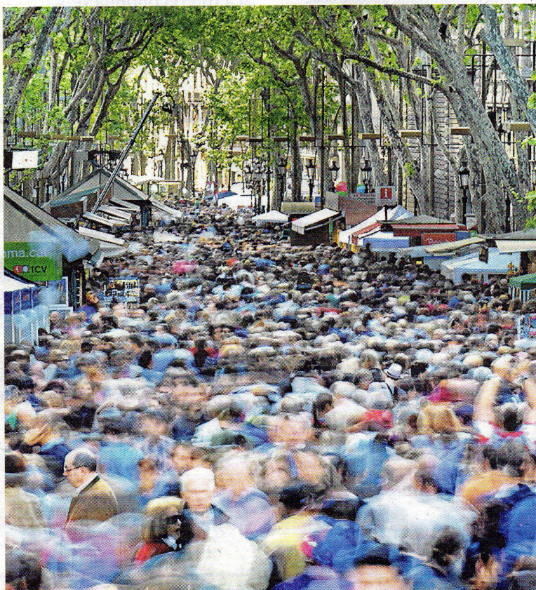
El sobiranisme majoritari ha fet molts passos per presentar una proposta d'independència integradora i plural. FRANCESC MELCION

centment, la duresa de la crisi econòmica. Les demostracions de força i responsabilitat de les grans mobilitzacions sobiranistes ho refermen. Si a aquesta onada democràtica, que també és majoria al Parlament, se li nega el dret a exercir el vot; si ens tallen les ales, ens tanquen l'aixeta, ens imposen una recentralització-exprés i ens toquen les escoles; si, resumint, l'unionisme guanya la partida contra la democràcia per la coerció de l'Estat amb el suport dels quatre despatsos de sempre, la fractura (si més no, emocional) la tenim assegurada. I per molt de temps.