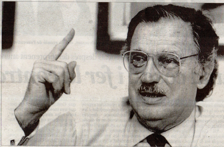
Ramon Trias Fargas, economista liberal i fundador d'Esquerra Democràtica de Catalunya, el 1988

Trenta-cinc anys després, Espanya es troba en molts aspectes entre parèntesis, el Govern de Madrid ja encarrega balances fiscals, la solidaritat del concert basconavarres és objecte de debat públic, l'Estat autòmic s'ha col·lapsat de la manera que va preveure Trias i els fills i nets dels emigrants senten arrelament. Catalunya ha experimentat un pacte social intern, no escrit, encara amb la pell sensible, però irreversible. Aquesta última dada és fonamental per entendre el nou concert dels catalans. Tot i que tingui notes desa-