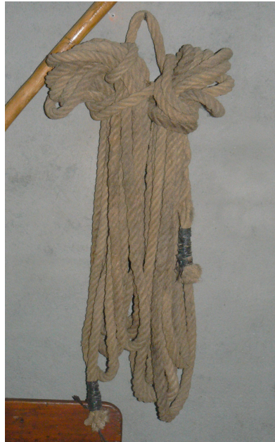
Cordes de garbejar, utilitzades per a lligar les garbes durant el transport en el carro cap a la masia.

Després d'haver segat tot el camp, es deixaven assecar les garberes durant dues o tres setmanes i després es carregaven als carros d'escala per portar-les a l'era. L'era consistia en una esplanada que solia estar col·locada davant de la casa i en la majoria de les masies estava feta de llosa.