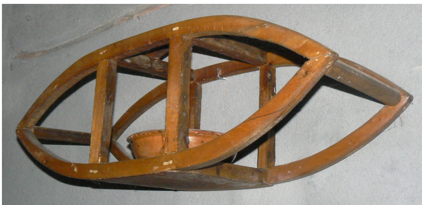
Estri que mantenia el llit calent a l'hora d'anar a dormir

Més endavant van anar apareixent altres sistemes, com el de la bossa d'aigua. S'escalfava aigua al foc i es disposava en bossetes, que es posaven a sobre els peus i els mantenia calents tota la nit.