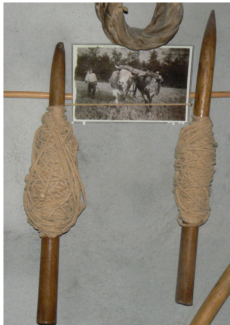
Cordills utilitzats per a marcar les fileres al camp

La preparació dels talls i la sembra es feien al març, i per a sembrar es transportaven els sacs amb carros fins al camp, juntament amb el paló, llargs cordills i senalles. Aquests cordills s'estenien al llarg del camp i es clavaven amb una estaca a cada extrem, després d'assegurar-se que estaven ben tibats.