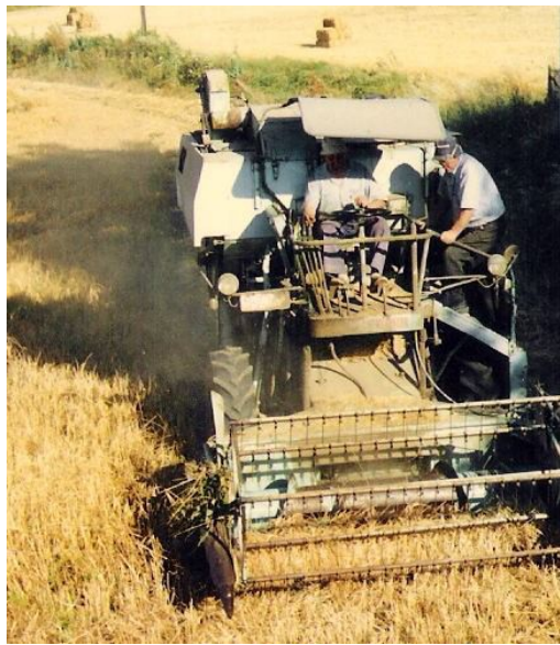
El meu avi segant amb una segadora un camp a Taradell

Amb la màquina de batre, una de les tasques més dures segons alguns dels testimonis, va passar el mateix i l'ajuntament també en va posar una a la plaça de les eres, i es compartia entre veïns. Alhora, un testimoni recorda com la Plaça i tots els seus negocis del voltant han canviat.