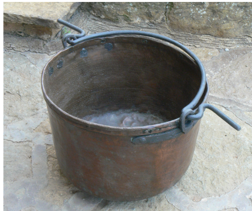
Estri anomenat perol que servia per a escalfar aigua

Una altra qüestió que cal destacar dins dels canvis en la masia, és en la manera d'escalfar els llits a l'hora d'anar a dormir, ja que cal tenir en compte que en aquella època no hi havia calefacció. Un dels testimonis, recorda com es passaven entre els que dormien a la mateixa habitació el que s'anomenava el "burro". Aquest consistia en un plat fet de ceràmica on es col·locava caliu del foc. Estava envoltat d'una estructura de fusta per tal de que quan es poses a dins el llit no cremés els llençols.