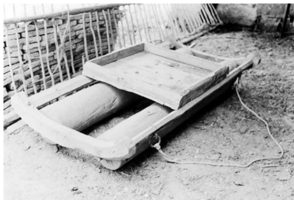
Imatge extreta d'Internet