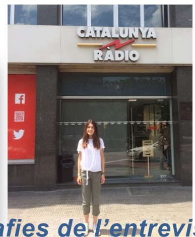
Fotografies de l'entrevista