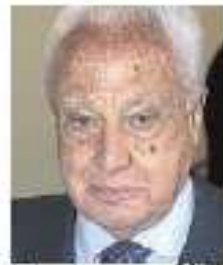
Jiménez de Parga

Tomás y Valiente que convendría no olvidar: «el Tribunal gana o pierde por lo que se hace pero también por lo que con él se hacen».