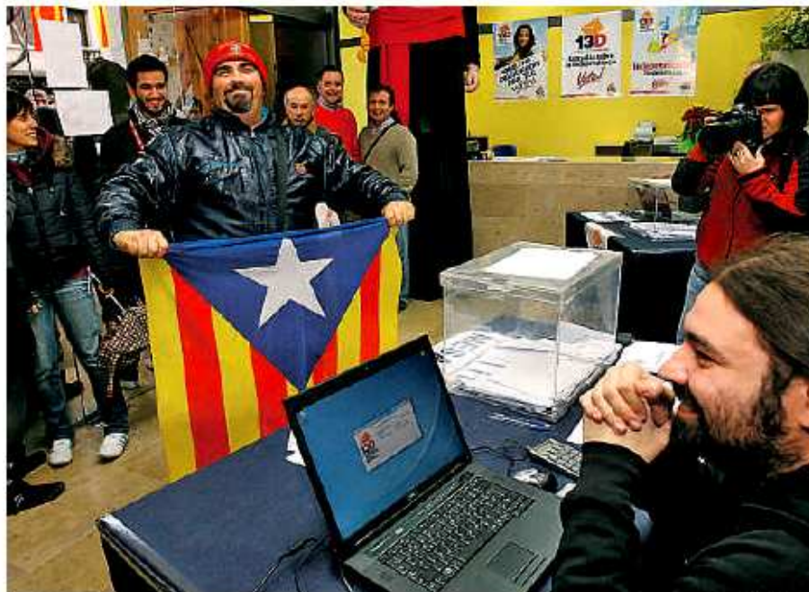
Los símbolos independentistas llenaron todos los locales habilitados como colegio electoral

Visito también las mesas del centro de Banyoles. En la