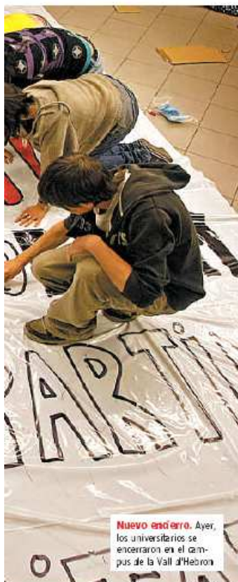
Nuevo estudio. Ayer, los universitarios se encerraron en el campus de la Vall d'Hebron