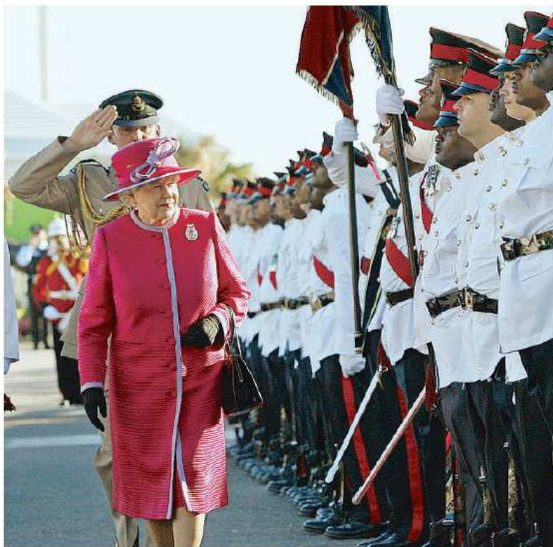
Visita soberana. Isabel II pasando revista a la guardia que le rinde honores durante su visita a Bermudas, el pasado 24 de noviembre, para conmemorar el 400 aniversario de la colonia

BERMUDAS ▶ Situada en el Atlántico frente a la costa este de Estados Unidos, es la colonia británica más antigua y la más poblada (65.000 habitantes). Consta de unas 150 islas y tiene una economía próspera, con una de las rentas per cápita más altas del mundo, basada en las finanzas y el turismo. Uno de los principales problemas es el elevadísimo coste de la vivienda. Fue descubierta en 1503 por el explorador español Juan de Bermúdez.