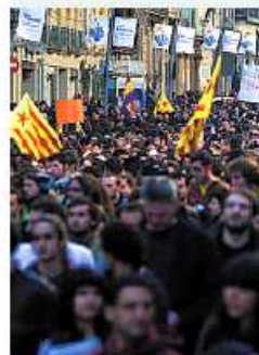
ASSOCIACIÓ D'UNIVERSITATS PÚBLIQUES CATALANES (ACUP)

• RETIRADA DE LOS EXPEDIENTES y de los procesos judiciales contra los 31 estudiantes de la UAB y absolución del joven detenido después de la manifestación del 20-N