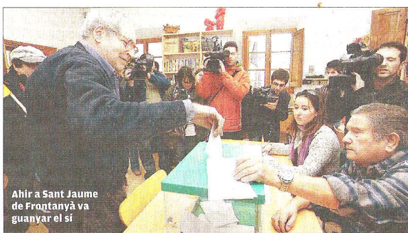
Ahir a Sant Jaume de Frontanyà va guanyar el sí

En qualsevol cas, les consultes han aconseguit despertar l'interès de la premsa internacional. Ahir, Le Monde ja editorialitzava. I no pas en negatiu. P4-10