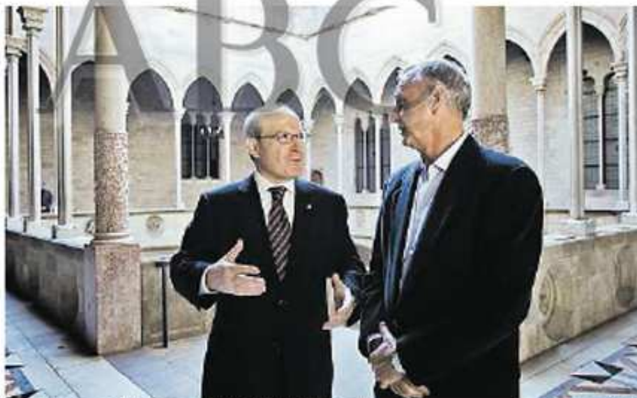
José Montilla, ayer, con el ex jugador de fútbol, el holandés Johan Cruyff

El texto escrito por la prensa catalana lleva el sello de la última intervención pública del presidente de la Generalitat, José Montilla, al acudir la convención catalana del Estatuto con «la meditación de un catalán de una España plural o el hilo que de la misma» y advierte de que «está en juego la propia dinámica constitucional, el espíritu de 1977, que hizo posible la pacífica transición». También se le unió con los postulados de los del PSIC con el del PSOL en la última día del mes en que el editorial culpa de todo el conflicto al PP, «un PP que