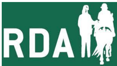
Icona de la Riding for the Disabled Association

Avui dia existeixen amplis programes desenvolupats i creats a països d'Europa com Àustria, Alemanya, França, Bèlgica, Dinamarca, Finlàndia, Holanda, Itàlia, Irlanda, Luxemburgo, Noruega, Polònia, Espanya, Suècia, i Suïssa. A Austràlia, Nova Zelanda i Sud-àfrica existeixen diverses associacions que estan afiliades a l'associació Anglesa RDA (Riding for the Disabled Association). Cap a Orient existeixen programes a Japó, Hong Kong, Malàisia, Singapur, Israel i Jordània. Respecte al continent Americà l'equinoteràpia es realitza de forma extensa a Estats units i Canadà. A Llatinoamèrica es poc coneguda i els representants més coneguts són Mèxic, Argentina i Brasil.