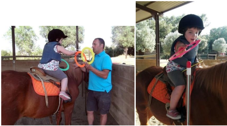
Més fotos de la sessió d'equinteràpia. Aquí s'observa la segona activitat que es va fer.