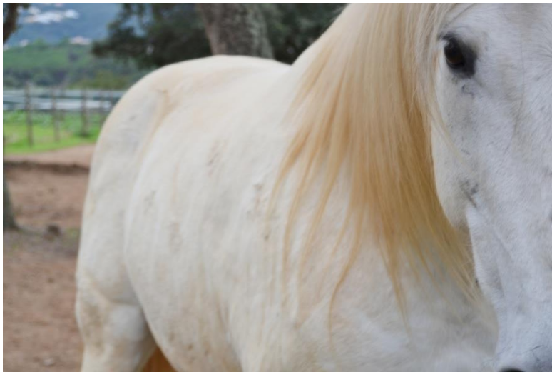
Diverses imatges de cavalls a l'hípica de Calonge.