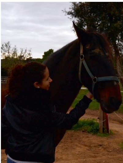
Una imatge amb el cavall Néron.