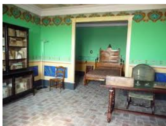
Museu Balmes, Casa Bojons, Vic