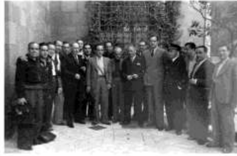
El president del govern català Lluís Companys amb el Comitè Central de Milícies Antifeixistes durant la primera reunió, a l'Escola Nàutica de Barcelona el 21 de Juliol de 1936.

El dia 20 al vespre, la revolta havia estat derrotada a Barcelona, però no només això, ja que va canviar per complet el panorama polític: la ciutat estava completament a mans dels anarquistes i les milícies obreres, que s'havien fet forts -només en l'assalt a la caserna de Sant Andreu els anarquistes van passar de tenir 200 fusells a tenir-ne 30.000- 45 . Es calcula que en aquell moment, la CNT tenia uns 30.000 militants, mentre que els serveis d'ordre públic només tenien 5.000 efectius. I es va obrir un nou debat polític: s'havia d'escollir entre un retorn a la legalitat republicana (que suposaria el manteniment de les institucions i el desenvolupament del programa del Front Popular) o la construcció d'un nou estat fruit de la revolució que acabava de començar, amb la predominança dels sectors més radicals del Front Popular 46 . Companys, veient la força dels anarquistes i com havien lluitat el dia 19, va escollir la segona opció. Òbviament, els caps de les forces d'ordre públic no van veure amb bons ulls la proposició de Companys, ja que a la pràctica significava entregar el poder i l'autoritat de la Generalitat a la revolució llibertària, però ho veien com la opció més realista. Per exemple, cito Escofet: