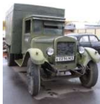
Exemplar de ZIS-5. 69

I l'avi estava a Intendència a transports i venia a la banda de València cap a Barcelona i portava fruites i arròs cap a Barcelona. 70