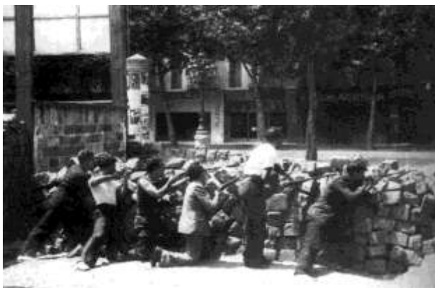
Foto d'Agustí Centelles presa el dia 19 de Juliol de 1936 a Plaça Catalunya, on el POUM va jugar un paper destacat.

El POUM salió a la calles el 19 de julio, como los demás organizaciones obreras, y luchó, con las pocas armas que tenían contra los sublevados; sus militantes tuvieron un papel destacado en las luchas en la Plaça de Catalunya y la Plaça Universitat. En todos los barrios hubieron luchas y participó con otros obreros construyendo barricadas y intentando de conseguir armas. 43