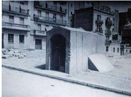
Entrada al refugi de la Plaça de la Farga. Avui en dia s'hi ha edificat a sobre. La foto data de 1941. 73