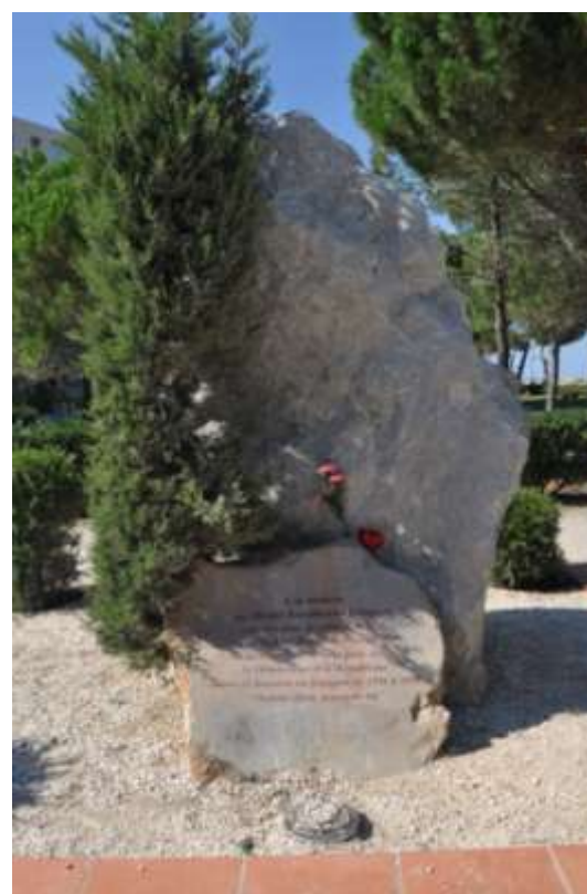
A la memòria dels 100.000 republicans espanyols, internats al camp d'Argelers després de la Retirada de Febrer de 1939. El seu mal: haver lluitat per defensar la Democràcia i la República contra el feixisme a Espanya de 1936 a 1939. "Home lliure, recorda-te'n."