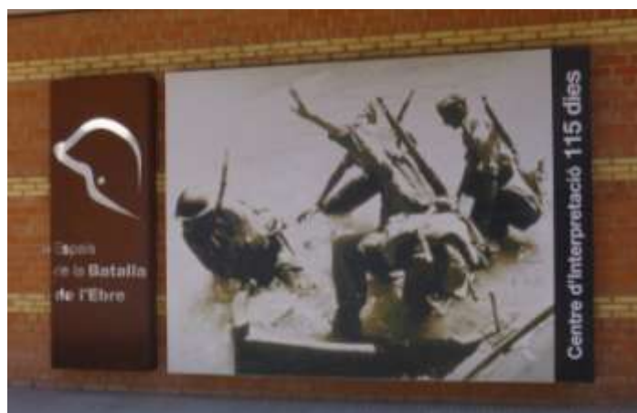
Centre d'interpretació a Corbera d'Ebre.