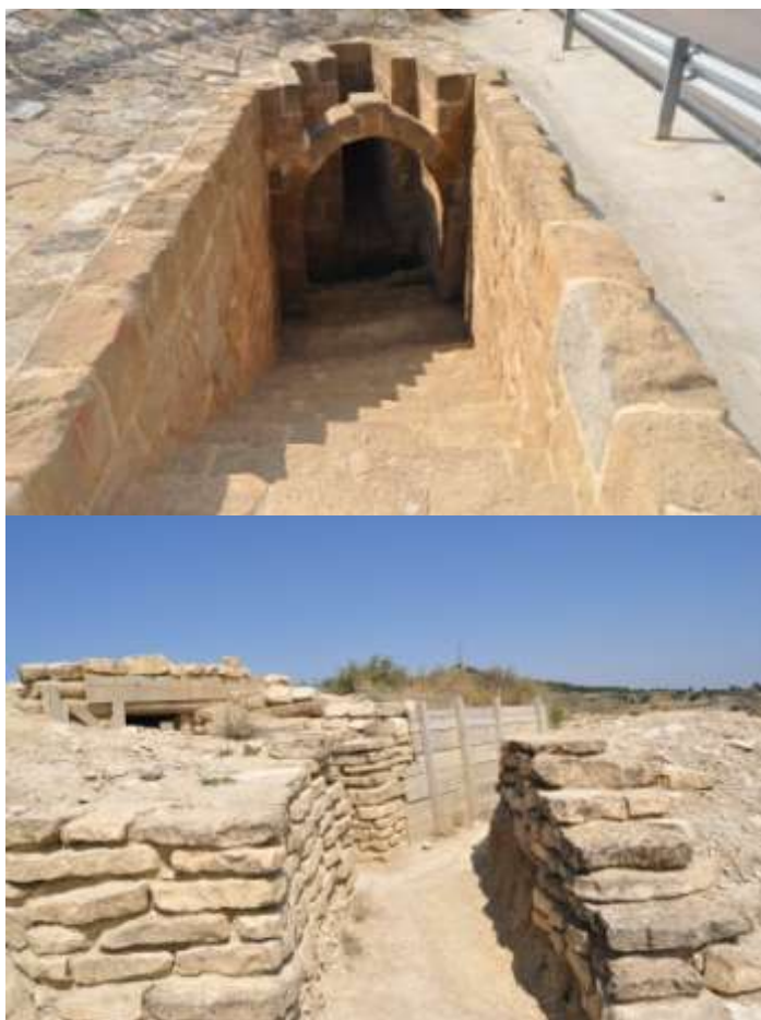
Búnquer a la carretera i trinxeres de la Ruta Orwell.

Ja per acabar, un altre aspecte que vaig voler treballar va ser veure de primera mà els escenaris de la seva vida. Per tant, vaig anar a Alcubierre i Leciñena. A la carretera vam veure-hi un búnquer, on hi havia la porta oberta. Hi vam entrar i era un passadís estret i baix, amb el terra que cada cop tenia més aigua fins que, al cap d'uns 15 metres es feia impracticable si no anaves preparat.