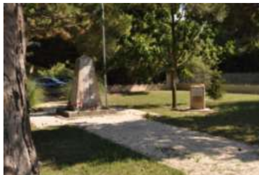
Cementiri dels espanyols a Argelers

També vaig anar a Corbera d'Ebre, a veure un centre d'interpretació de la batalla de l'Ebre anomenat 115 dies . Aquesta visita em va impactar molt, ja que, a més de informar-me sobre la Batalla de l'Ebre en els aspectes més militars i estratègics, donava una visió des de l'aspecte de les persones que havien de lluitar en unes condicions duríssimes en una batalla