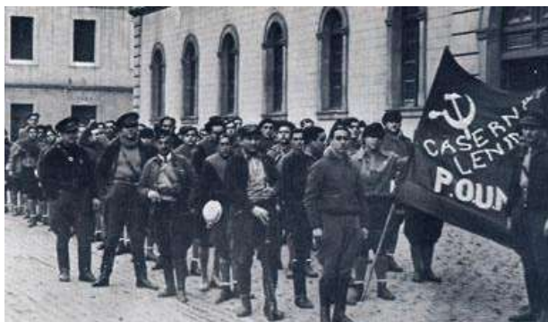
Segona columna del POUM a la Caserna Lenin de Barcelona. Al fons es distingeix George Orwell, que destaca per l'alçada.

La dues primeres columnes que van marxar cap al front d'Aragó van ser la columna Durruti i la columna Ascaso, ambdues de la CNT que van marxar, respectivament, el 24 i el 25 de juliol. La primera columna del POUM no sortiria de Barcelona fins el dia 25 de juliol, amb 2.000 homes i una bateria d'artilleria, i dirigida per Jordi Arquer i Manuel Grossi. Però no va ser la única columna del POUM. També fou important la columna dirigida per Josep Oltra, Picó i Balada, també anomenada "La Segona columna del POUM" o, més endavant la columna "Alcubierre" 54 .