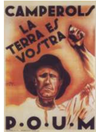
Cartell del POUM, obra de Siwe que data de 1936.

La fusión (del BOC i de la ICE) se ha realizado sobre la base de un programa redactado en común, como resultado de una discusión que ha durado meses, y que contiene todos nuestros principios fundamentales: afirmación del carácter internacional de la revolución proletaria, condena de la teoría del socialismo en un solo país, de la dictadura democrática del proletariado y del campesinado, defensa de la URSS, con el absoluto derecho de criticar todos los errores de la dirección soviética, afirmación de la bancarrota de las II y III Internacionales y de la necesidad de restablecer la unidad del movimiento obrero internacional sobre una nueva base. 30