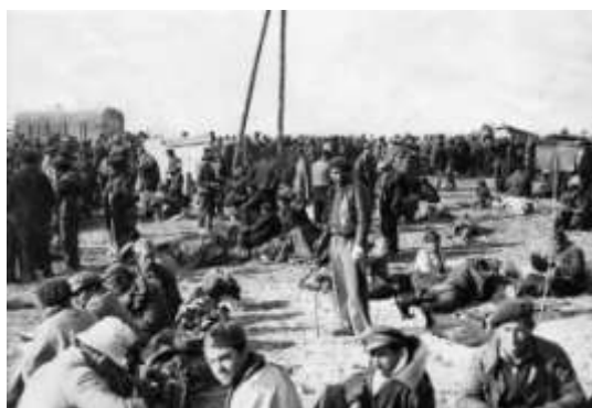
Refugiats al Camp d'Argelers. 86