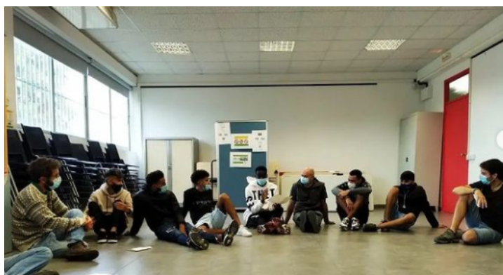
Figura 6: Extreta del instagram @pilbages (2021, 24 setembre)