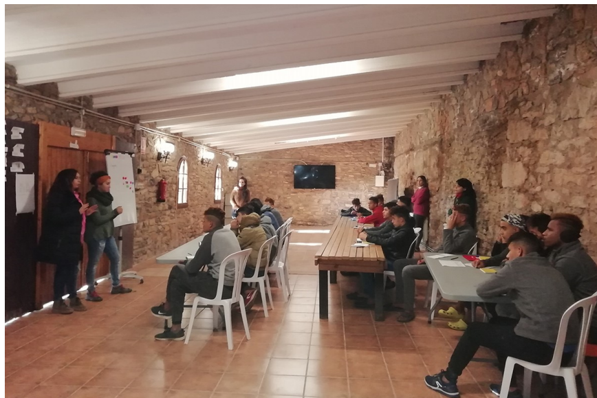
Figura 5: R. (2018b, diciembre 5). Al Bages hi ha 115 menors estrangers sense acompanyament familiar. NacióManresa.