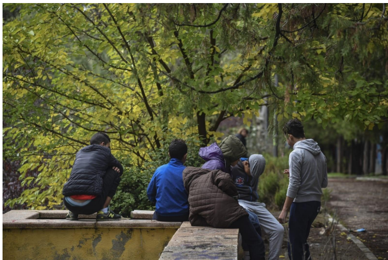
Figura 6: Cabo, N. (2020, 19 julio). Sin hogar, apoyo ni recursos: la realidad de los menas al cumplir los 18 años. elplural.com.

La oportunitat de ser acceptat s'acaba reduint a un perfil de joves exemplars, quasi excel·lents, que tenen ganes d'estudiar, i en queden fora els més immadurs i amb menys autonomia, ja que no hi ha suficients places. Els que no compleixen els requisits queden en una situació molt vulnerable i poden acabar en centres convivint amb persones sense llar.