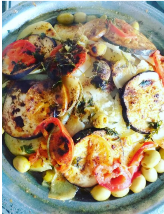
Figura 7: Extreta del instagram @pilbages (2021, 18 octubre)

més facilitats a l'integrar-se. Per exemple, l'Alejandro l'estudia a l'institut, a part que totes les classes es fan en català i les formacions externes també.