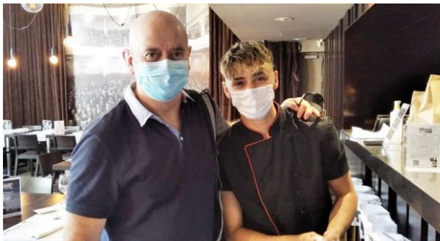
Figura 5: Extreta del instagram @pilbages (2021, 12 juliol)

Els cursos que es fan dins d'aquest programa, acaben amb pràctiques amb empreses externes. La persona encarregada de busca'ls-hi feina, es posa en contacte amb les empreses i els ajuntaments, presentant el projecte i han d'estar al cas de si surten plans d'ocupació on hi puguin anar a treballar aquest perfil de nois.