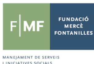
Figures 1 i 2: Logotip de les fundacions