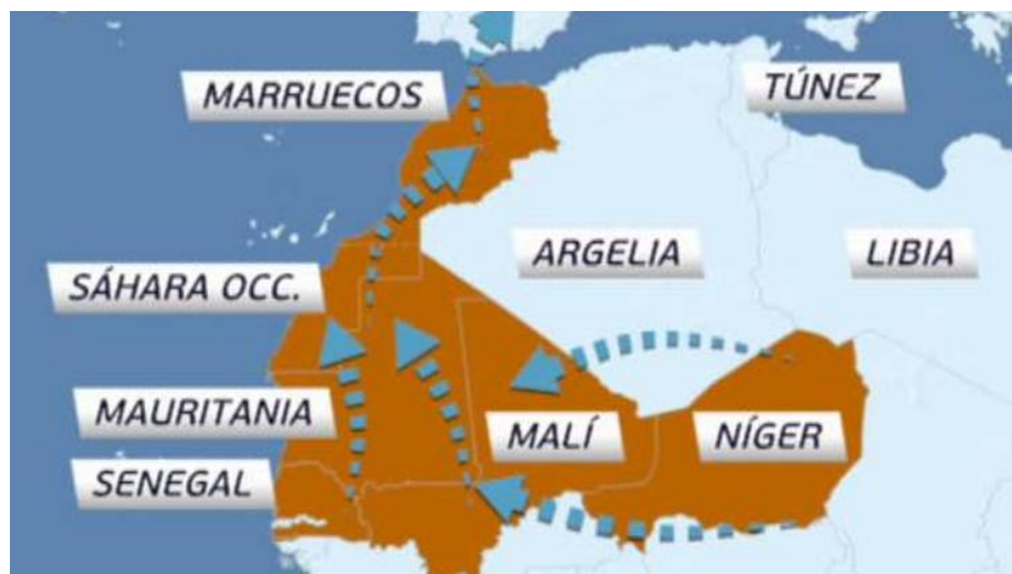
Figura 2: A.B.C.I. (2018, 11 agosto). Marruecos, la gran ruta de la inmigración subsahariana. ABC.

Tots els llocs d'origen que es troben a l'Àfrica subsahariana, es dirigeixen al Marroc per poder arribar a Europa, ja que es tracta del punt més proper, i això ho fan a través de les diverses rutes que podem veure en aquest mapa.