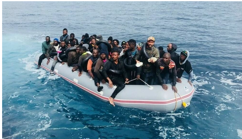
Figura 1: Nuevainformación.Es, R. (2019, 29 mayo). RESCATAN 47 INMIGRANTES MAGREBÍES DE DOS PATERAS DEL ESTRECHO Y 36 DE ELLOS SON MENAS.

trobar un canvi de vida cap a millor. Fent això, estan aconseguint traspasar la frontera sense pagar a ningú, ja que no disposen de mitjans econòmics per pagar els intermediaris de les màfies. També ho fan, però en menor quantitat, posant-se directament a l'interior del camió o dels ferris, directament com a polissons o nedant i pujant per la corda de l'àncora. Alguns d'aquests menors a l'hora de passar la frontera, tenen un gran avantatge i és que aprofiten el seu tamany reduït per introduir-se als mitjans que els transportaran cap a un lloc nou.