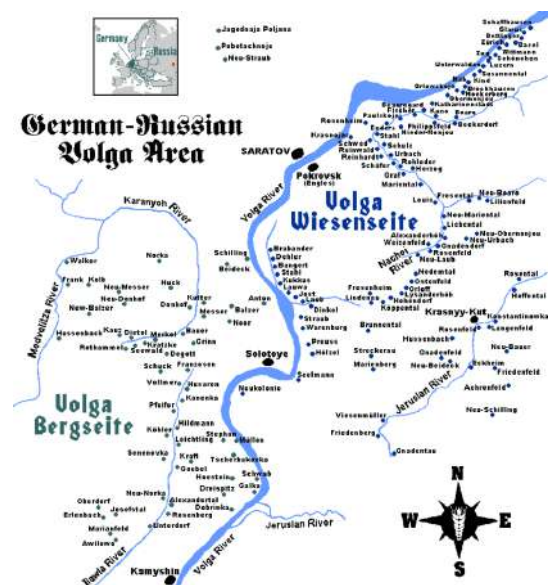
Figura 3. Principals colònies alemanyes del Volga.

Després que es consolidés el comunisme, el govern soviètic va voler atorgar privilegis a les minories ètniques amb motivacions propagandístiques per dur a terme la revolució socialista internacional. En conseqüència, el règim soviètic va crear la Comuna Obrera Alemanya del Volga l'octubre de 1918. Posteriorment, es va crear la República Autònoma Socialista Soviètica dels Alemanys del Volga (RSSA) el febrer de 1924, més com a model socialista perquè els comunistes alemanys de Weimar imitessin que com a base permanent d'independència cultural i ètnica alemanya. La gran majoria dels líders d'alt rang de la RSSA