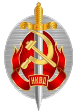
Imatge 8. Emblema del NKVD.

En els pròxims anys Kamenev i Zinoviev, primer, i Heinrich Jagoda (cap del NKVD fins al 1936), van ser executats, entre molts altres. A partir de llavors, el NKVD va adquirir la competència de l'organització de les purgues sent important apuntar que des del juny de 1934 fins a l'agost de 1939 es van produir 750.000 fusilaments i 1 milió de deportacions als gulags . A més, durant la primavera del 1935, els anteriors expulsats del Partit Comunista van ser arrestats i deportats amb el pretext d'eliminar els elements antisoviètics.