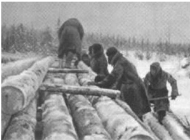
Fotografia 14. Treball a la trudarmiya , (1942).

Inicialment, 45.000 homes havien de treballar en la tala d'arbres, 35.000 construint els complexos metal·lúrgics de Bakal i Bogoslov i 40.000 construint vies de ferrocarril. Els enviats per talar arbres i construir fàbriques s'havien de lliurar al NKVD, mentre que els enviats per posar vies de ferrocarril havien de passar sota l'administració del NKPS. El decret va ordenar la mobilització de 120.000 alemanys ètnics sense cap judici ni sentència, només per la seva “nacionalitat” alemanya. Unes 80.000 d'aquestes persones, de fet, havien de complir els seus termes indefinits de treball forçat en els mateixos gulags on els delinqüents condemnats servien, tenint les mateixes condicions legals i materials. El decret esmenta específicament que el subministrament d'aliments i altres béns als mobilitzats alemanys havia de ser idèntic al subministrament dels presoners dels camps.