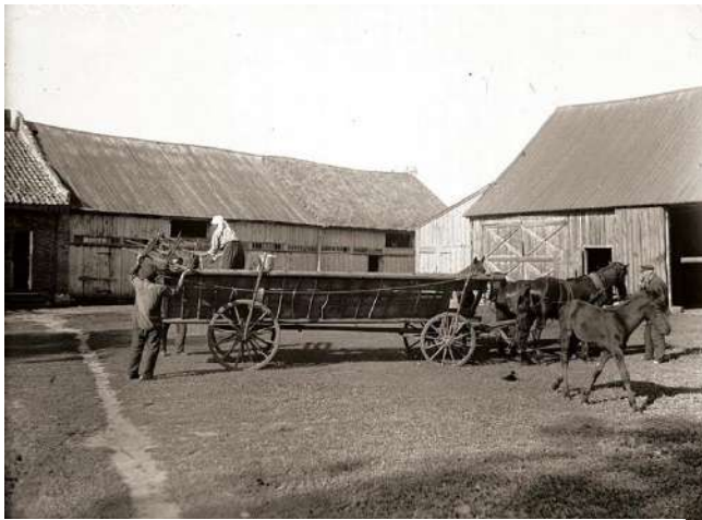
Imatge 2. Colònia menonita de la República Autònoma Socialista Soviètica dels Alemanys del Volga, (1927).

Les comunitats alemanyes de tot l'Imperi Rus mantenien la seva identitat i relacions amb Alemanya, un exemple seria que els matrimonis amb eslaus eren molt escassos, mantenint així la seva identitat profundament alemanya.