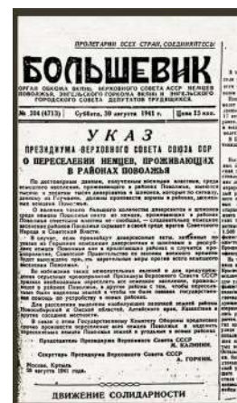
Fotografia 12. Decret sobre el reassentament dels alemanys del Volga.

L'únic assentament compacte i el més gran d'alemanys ètnics a l'URSS estava situat al voltant del Riu Volga i era oficialment una regió autònoma, la República Socialista Soviètica Alemanya del Volga. El règim estalinista va netejar ètnicament aquest territori de la seva "nacionalitat" titular, l'alemanya, dos mesos després de la invasió Nazi. L'ordre per la seva deportació va ser emesa en secret pel Comitè Central (Tsk) del Partit Comunista i pel Consell de Comissaris del Poble 18 (Sovnarkom) el 26 d'agost de 1941. El decret oficial (legal), que es va fer públic i ordenava la deportació dels alemanys del Volga, provenia del Presídiu del Soviet Suprem 19 el 28 d'agost de 1941. Aquest decret acusava falsament els alemanys del Volga d'albergar desenes de milers de sabotejadors i espies lleials al Reich alemany, ordenant la deportació total d'aquesta població a Sibèria i Kazakhstan com a mesura preventiva de seguretat. El decret especificava que tots els alemanys del Volga havien de ser deportats sobre aquesta base. Aquestes acusacions van ser la justificació oficial del govern soviètic per la deportació dels alemanys ètnics fins al 1964, quan van anul·lar oficialment les acusacions de traïció.