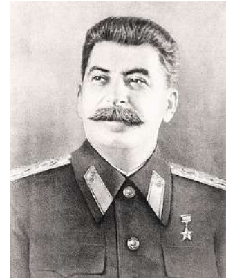
Imatge 5. Retrat oficial de Iósif Stalin.

Va néixer a la regió caucàsica de Geòrgia sotmesa al poder dels tsars. Va quedar orfe sent molt jove i va estudiar en un seminari eclesiàstic, d'on va ser expulsat per les seves idees revolucionàries el 1899. En deixar el seminari es va unir a la lluita clandestina dels socialistes russos en contra del règim tsarista. El 1903 es va unir al Partit Socialdemòcrata seguint a la facció bolxevic que encapçalava Lenin.