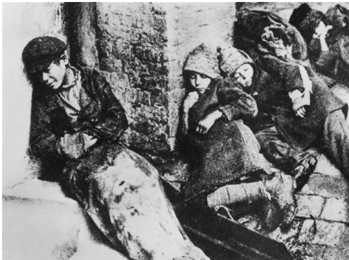
Fotografia 7. Diversos nens sense llar dormen al carrer el 1933, durant el Holodomor.

El blat produït en els kolkhoz era exportat a fora del país per pagar la industrialització que el Pla exigia i a partir del 1930 es va començar a confiscar de forma abusiva el gra i el blat d'Ucraïna, deixant les terres sense les llavors necessàries perquè poguessin germinar i sense