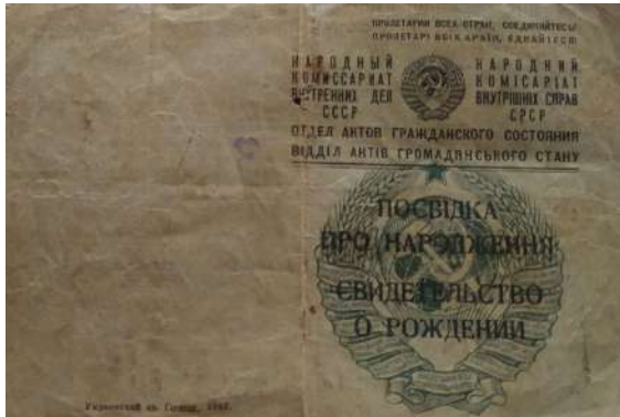
Fotografia 10. Portada de la partida de naixement de Viera Andreievna Gmirianskaya, (Mariúpol, 2022).

A causa d'aquesta diversitat ètnica, a la Unió Soviètica els ciutadans eren separats i diferenciats segons “nacionalitats”, concepte que a la Unió feia referència a l'origen ètnic en contraposició amb el concepte més conegut internacionalment. Aquesta informació era utilitzada en documents com les partides de naixement i els passaports dels ciutadans. En el cas de la partida de naixement hi havia escrita l'ètnia dels progenitors i la de la persona que naixia. Si els pares eren d'ètnies diferents es podia decidir quina de les dues “nacionalitats” s'escrivia a la partida de naixement i posteriorment al passaport.