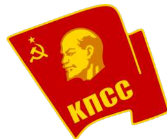
Imatge 6. Logotip del PCUS

El Partit-Estat i la Nomenklatura 8 foren pilars fonamentals del sistema estalinista. Malgrat que Stalin fos el líder incontestable del Partit, de l'Estat i de la societat, moltes vegades es recolzava en les estructures i classes dirigents per preservar la seva figura, sobretot en moments delicats que poguessin desencadenar en un brot de malestar social i polític. A causa