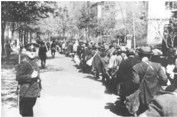
Fotografia 13. Alemanys ètnics dirigint-se als vagons de tren per ser deportats, (Engels, 1941).

Seguint les deportacions dels alemanys del Volga, el NKVD va ressituar forçadament la resta de comunitats alemanyes de les regions occidentals de l'URSS a Kazakhstan i Sibèria. Mentre que el govern soviètic va deportar la majoria d'alemanys del Volga a Sibèria, va enviar la majoria dels altres alemanys ètnics a Kazakhstan. Entre aquestes zones netejades d'alemanys ètnics hi trobem Moscou, el nord del Caucas, Ucraïna oriental i Transcaucasia. Un resum de cinc pàgines de la deportació dels alemanys ètnics i la seva posterior mobilització a l'exèrcit obrer ( trudarmiya ), que el ministre d'Afers Interns, Kruglov, va enviar a Beria el 12 de desembre de 1948, afirmava que entre 1941 i 1942 el govern soviètic va ressituar internament 806.533 alemanys ètnics de zones cèntriques de l'URSS cap a zones perifèriques.