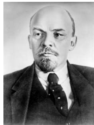
Imatge 4. Retrat de Lenin.

El 1898 es va fundar el Partit Obrer Socialdemòcrata Rus (POSDR) una de les primeres organitzacions obreres de classe. El 1904 el partit es va dividir en dues parts: els bolxevics i els menxevics. Els menxevics eren un partit de masses que seguia les directrius de la Segona Internacional 5 . En canvi, els bolxevics eren un nou tipus de partit més minoritari que tenia una organització més rígida i centralitzada, estant integrat per revolucionaris disposats a aconseguir el poder per la força, tenint com a líder a Vladímir Ílitx Uliànov (Lenin).